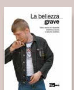
LA BELLEZZA GRAVE Autori vari Progetto grafico Andrea Biancalani Anno di pubblicazione 2013 Pagine 160