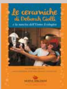
STORIA DI TERRA Le ceramiche di Deborah Ciolli Autore Filippo Polenchi Progetto grafico Andrea Biancalani Anno di pubblicazione 2014 Pagine 16