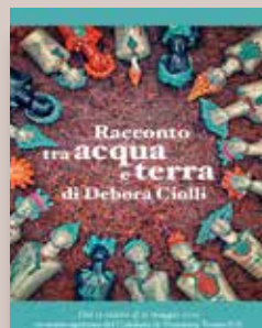
RACCONTO TRA ACQUA E TERRA Autore Deborah Ciolli Progetto grafico Andrea Biancalani Anno di pubblicazione 2015 Pagine 16