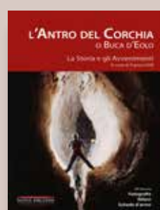
L'ANTRO DEL CORCHIA A cura di Franco Uttili. Autori vari Progetto grafico Andrea Biancalani Anno di pubblicazione 2012 Pagine 344