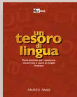
UN TESORO DI LINGUA Autore Fausto Raso Progetto grafico Andrea Biancalani Anno di pubblicazione 2016 Pagine 322