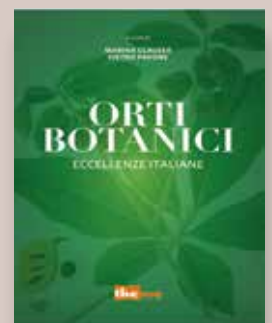
ORTI BOTANICI A cura di Marina Clauser e Pietro Pavone. Autori vari Progetto grafico Andrea Biancalani Anno di pubblicazione 2016 Pagine 302