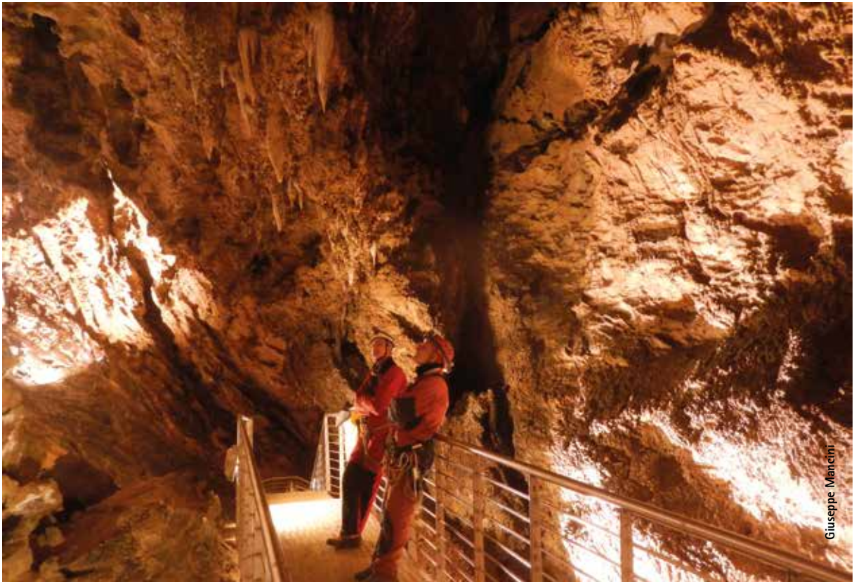
Le passerelle turistiche consentono anche di ammirare la struttura delle gallerie