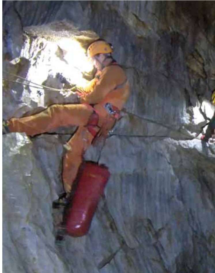
Galleria -240 Fighiera Traverso

È l'alba del 24 aprile, siamo nel 1977, la notte l'ho passata praticamente insonne per l'eccitazione, qui al Vallechiera, a Levigliani, sulle Apuane. Finalmente ho l'occasione, dopo mesi di fantasticherie