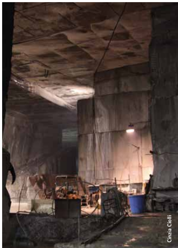
Le imponenti cave di marmo

Il mercurio si trova normalmente legato allo zolfo,