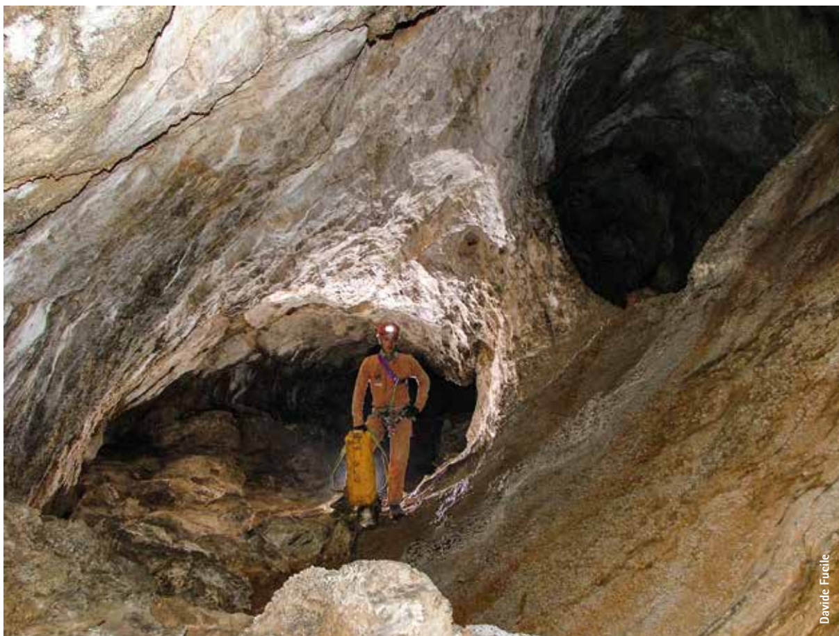
Gallerie dei Maremmani