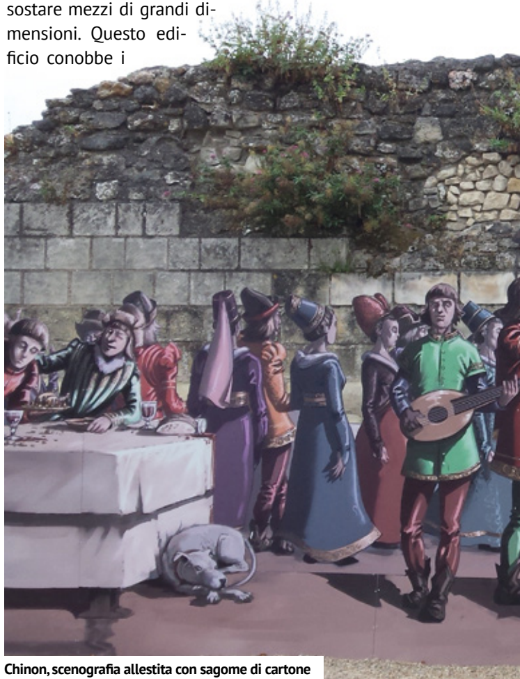
Chinon, scenografia allestita con sagome di cartone