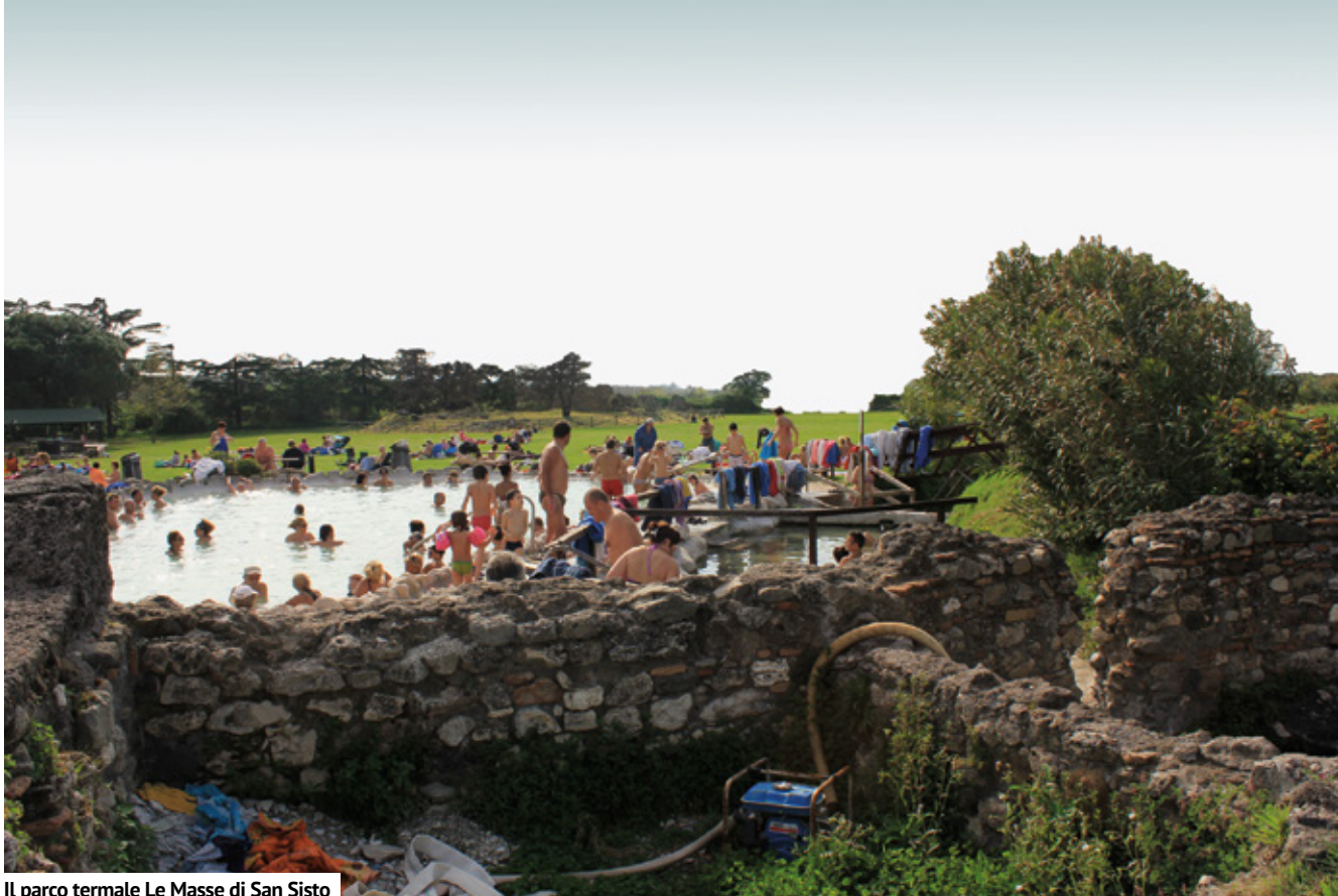
Il parco termale Le Masse di San Sisto

come la festa della Merca a Tarquinia. A fine aprile si tengono ogni anno la sagra del Biscotto e il Palio di Sant'Anselmo a Bomarzo. Il biscotto di Sant'Anselmo vanta un'antica ricetta; infatti, lo commissionò proprio Sant'Anselmo nel V secolo come cibo da distribuire ai pellegrini che transitavano lungo la via Francigena. Altro evento consolidato e molto frequentato è la sagra del Lattarino a Marta, nell'ultimo fine settimana di maggio. In estate, poi, sagre, rievocazioni ed eventi di ogni genere, come la sagra della pastorizia a Farnese e la festa della nocciola a Caprarola. Finisco col segnalare per il mese di settembre le sagre dedicate ai funghi porcini e ai tartufi, altri prodotti tipici del posto.