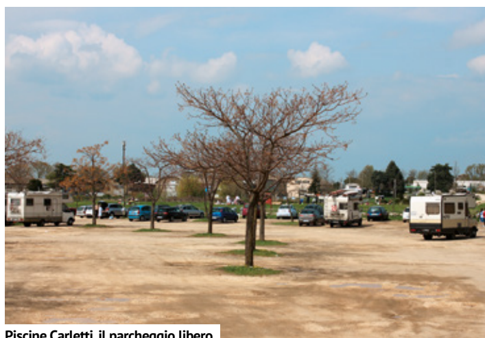
Piscine Carletti, il parcheggio libero