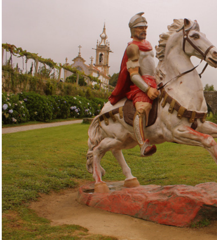
Ponte de Lima, scultura e Ponte Velha, l'antico ponte romano