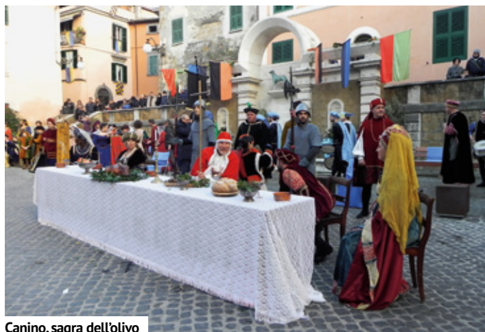
Canino, sagra dell'olivo

come la festa della Merca a Tarquinia. A fine aprile si tengono ogni anno la sagra del Biscotto e il Palio di Sant'Anselmo a Bomarzo. Il biscotto di Sant'Anselmo vanta un'antica ricetta; infatti, lo commissionò proprio Sant'Anselmo nel V secolo come cibo da distribuire ai pellegrini che transitavano lungo la via Francigena. Altro evento consolidato e molto frequentato è la sagra del Lattarino a Marta, nell'ultimo fine settimana di maggio. In estate, poi, sagre, rievocazioni ed eventi di ogni genere, come la sagra della pastorizia a Farnese e la festa della nocciola a Caprarola. Finisco col segnalare per il mese di settembre le sagre dedicate ai funghi porcini e ai tartufi, altri prodotti tipici del posto.