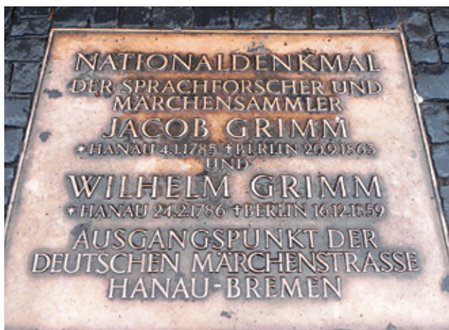
Sopra: Schwalmstadt, Cappuccetto Rosso (Rotkäppchen); e la targa in memoria dei fratelli Grimm ad Hanau; A lato: Hanau, il monumento ai fratelli Grimm

più decorato della città. La Hochzeitshaus (Casa di nozze), della seconda metà del Cinquecento, con alti frontoni ad arco. La sua posizione non consentiva di vederne la facciata dalla piazza, ma solo l'angolo, così l'architetto del palazzo, Hans Meurer, progettò uno splendido bovindo sul lato dell'edificio rivolto verso la Marktplatz. Buffissima una casa con due vere sedie "incollate" sulla facciata. In paese c'è un piccolo museo chiamato Casa delle Favole, Alsfelder Märchenhaus, aperto di mercoledì, sabato e domenica dalle 14 alle 17 (adulti 2 euro, bambini 3 euro, festa di compleanno 39 euro). Ripartiamo anche da qui per la città più a sud di questo percorso: Hanau. Parcheggiamo vicino alla piazza centrale, ci sono pochissime persone in giro e i negozi sono tutti chiusi, come sempre di domenica in Germania! Il tempo è incerto, così la nostra visita si limita alla piazza centrale, dov'è situata la statua ai Fratelli Grimm. Alziamo la testa dalle pagine delle fiabe, e lasciamo così l'ultima città della Via. Abbiamo in verità dedicato pochi giorni, ci vorranno almeno altri due viaggi per completarla, visto che sono 52 i paesi che, tra fiabe e monumenti notevoli, compongono questo percorso tematico. Abbiamo saltato molte città e anche molti musei, ma il nostro motto è lasciar sempre qualcosa da vedere per tornare. Ci dirigiamo quindi verso Monaco di Baviera, ma... questa è un'altra fiaba!