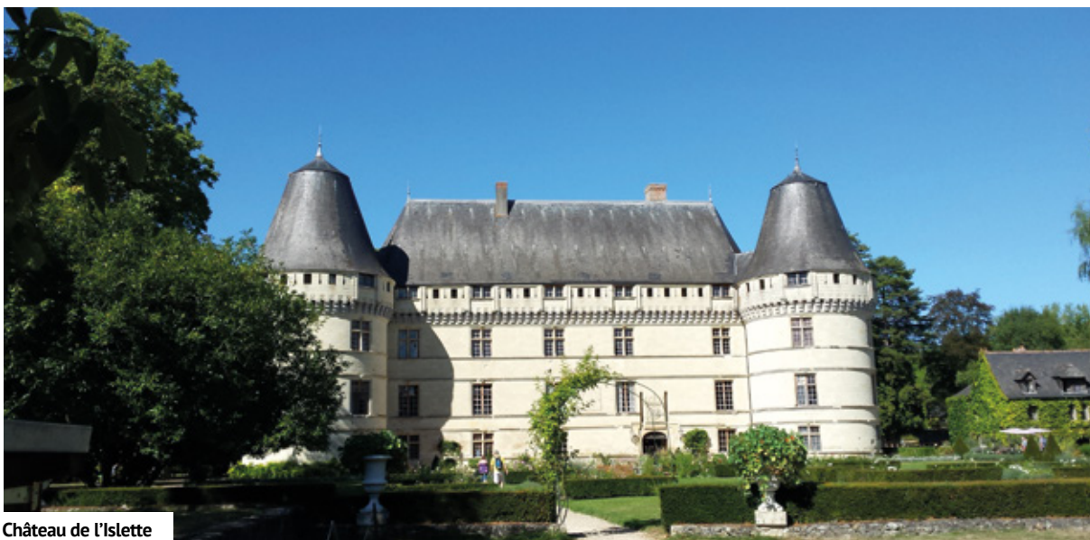
Château de l'Islette

comprendere il paesaggio rinascimentale: decise così di abbattere alberi, liberare il fossato e ridare all'interno parco le sembianze del giardino rinascimentale di tipo francese. Piante aromatiche, fiori, ortaggi: un insieme di colori e odori disposti in perfette geometrie che vanno a comporre il "giardino ornamentale", il "giardino d'acqua", il "giardino del sole", il "giardino dei semplici", il labirinto e l'orto. Il giardino ornamentale è, a sua volta, suddiviso in quattro settori che rappresentano simbolicamente quattro tipologie di amore: l'amore tenebroso, l'amore passionale, l'amore instabile e l'amore tragico. Impossibile da descrivere, l'immenso parco verde di Villandry è decisamente da non tralasciare.