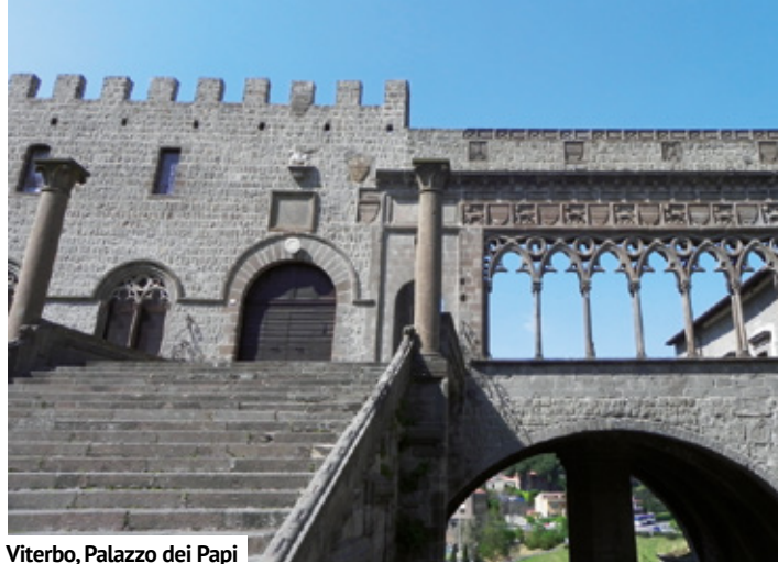
Viterbo, Palazzo dei Papi

«Tacendo divenimmo la 've spiccia fuor della selva un picciol fiumicello, lo cui rossore ancor mi raccapriccia. Quale del Bullicame esce ruscello che parton poi tra lor le peccatrici, tal per la rena giù sen giva quello. Lo fondo suo ed ambo le pendici fatt'era 'n pietra, e margini dallato» (Dante,