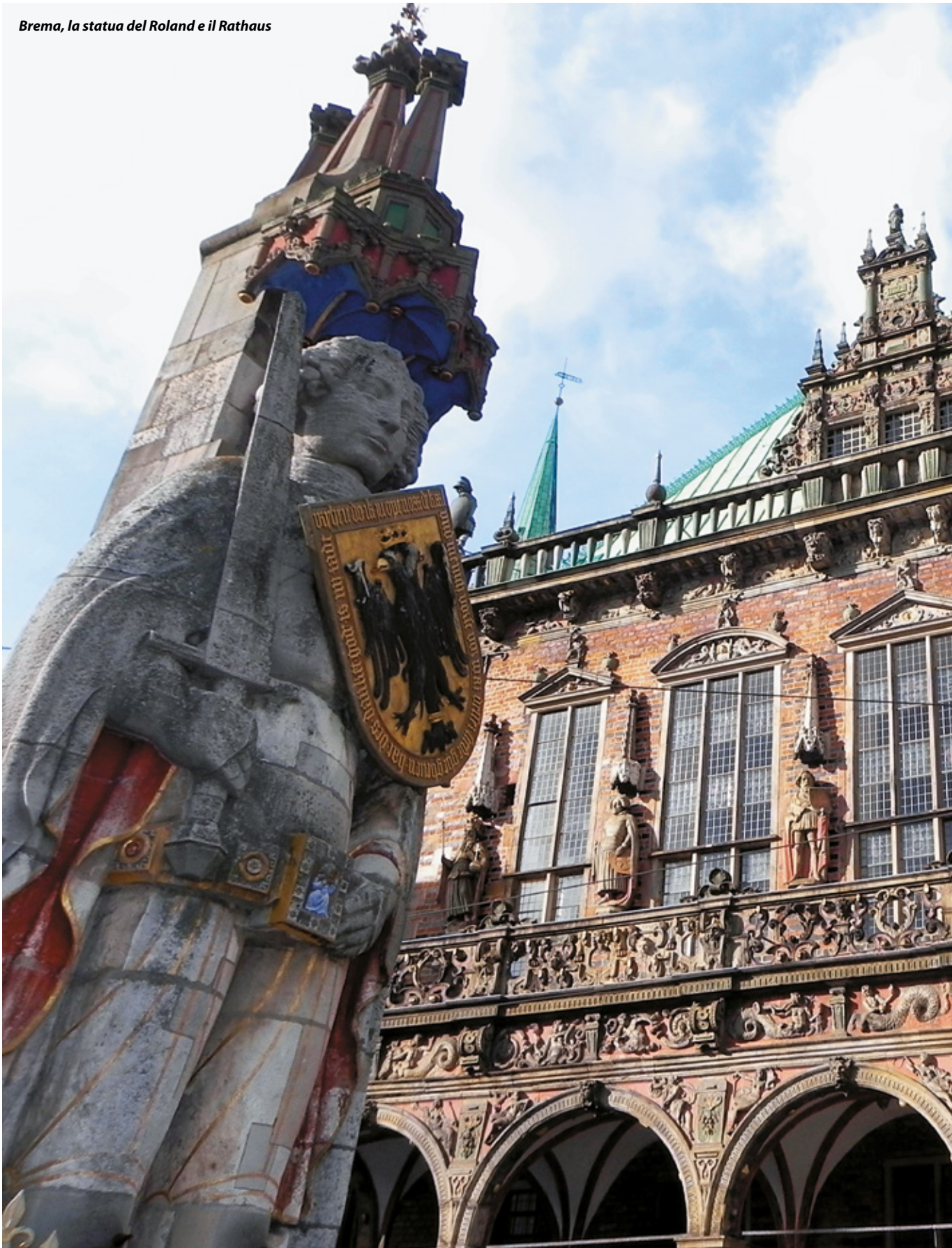
Brema, la statua del Roland e il Rathaus