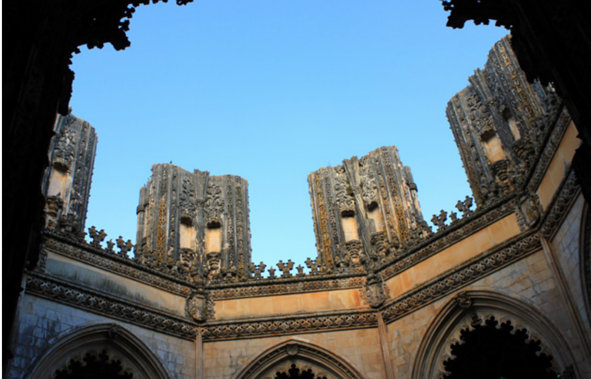
Batalha: Mosteiro de Santa Maria da Vitória, le Capelas Imperfeitas (Cappelle Incompiute)

Ci spostiamo quindi ad Aljustrel per vedere le case dei pastorelli e gli altri luoghi delle apparizioni. Da qui ripartiamo con destinazione Batalha.