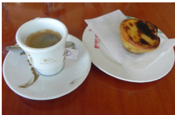
In alto, Porto: la Cattedrale . Al centro, un azulejo a Aveiro . In basso, un caffè accompagnato da un Pastei de nata a Coimbra