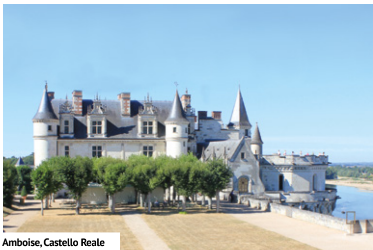
Amboise, Castello Reale

sua notorietà alla figura del Re Francesco I di Francia. Anche qui un'altra testimonianza dell'accoglienza francese nei riguardi del turismo itinerante.