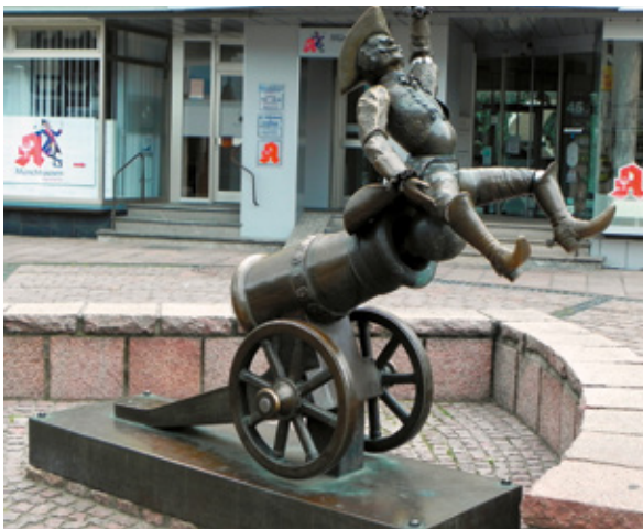
Qui e a lato: Bodenwerder, due delle storie inverosimili del Barone di Münchhausen