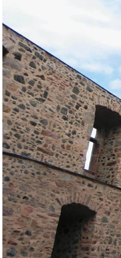
Sababurg, il Castello della Bella Addormentata (Dornröschenschloss) In basso a destra: Kassel, il Parco di Wilhelmshöhe