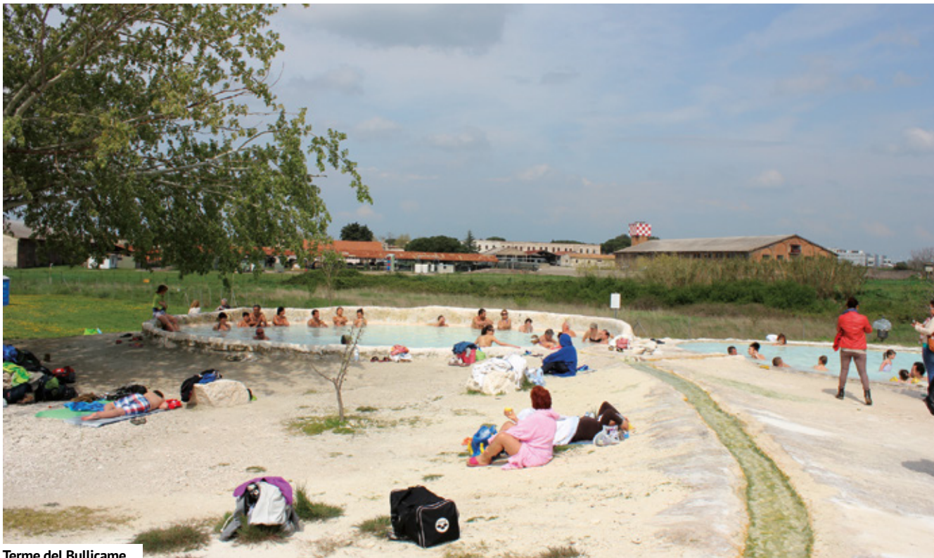
Terme del Bullicame

Inferno - canto XIV, vv.76-84). Quest'area è stata per molto tempo inaccessibile, finché il comune di Viterbo ha effettuato dei lavori di bonifica della zona, dando vita al Parco del Bullicame. È stata recintata, dotata di telecamere di videosorveglianza dal lato del parcheggio, sono stati installati dei pannelli informativi riguardanti la flora, la fauna e le proprietà delle acque ed è sorvegliata da un custode, che vigila sul comportamento degli utenti. Gentilissimo, ci ha guidato nei vari settori del parco e ci ha mostrato la curiosissima dimora del rospo smeraldino: un piccolo specchio d'acqua dai mille nascondigli che lui, naturalmente, usa per cercare di sfuggire agli sguardi curiosi. Le terme del Bullicame sono aperte da novembre ad aprile, dalle 8 alle 17.30 e da maggio a ottobre dalle 7 alle 21. C'è una lunga pozza dove bagnarsi e, alla sorgente, l'acqua sgorga a 55 °.