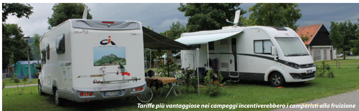
Tariffe più vantaggiose nei campeggi incentiverebbero i camperisti alla fruizione

VIVERE FANO, il quotidiano della città e del territorio ha pubblicato per intero il suddetto intervento , clicca su http://www.viverefano.com/index.php?page=articolo&articolo_id=403720 e gli altri interventi aprendo http://www.viverefano.com/index.php?page=articolo&articolo_id=403476