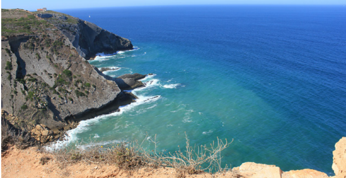
Capo Espichel a strapiombo sulloceano. SULLA falesia sono visibili le "impronte dei dinosauri"