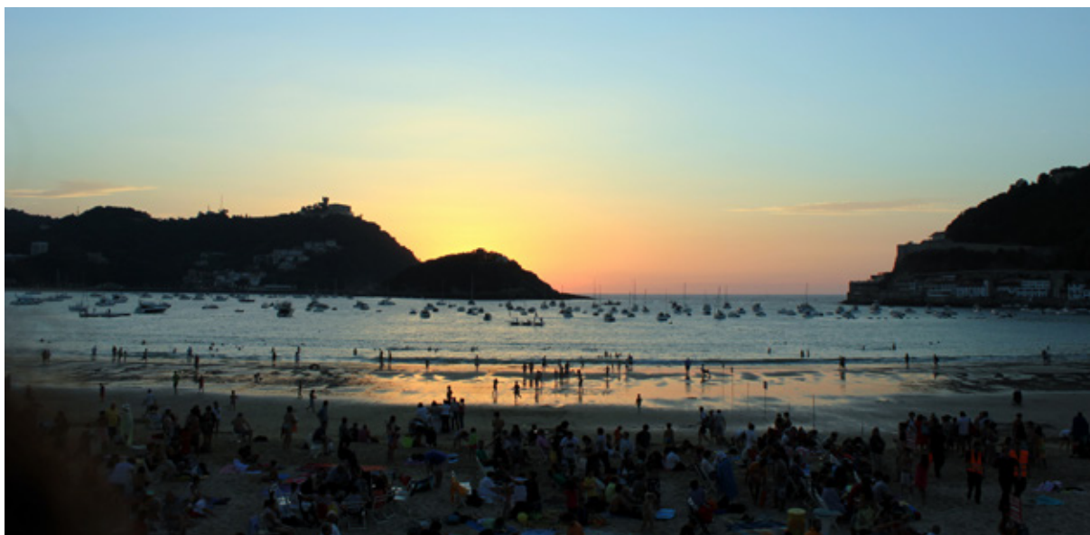
Sopra, San Sebastian: Playa de la Concha . Al centro, il segnale per il Cammino di Santiago . In basso, Santiago de Compostela: la statua di San Giacomo sulla facciata della Cattedrale

è famosa soprattutto per gli eventi del periodo cataro, tanto che questi eretici vennero chiamati albigesi proprio perché avevano qui il loro centro principale. Impossibile non visitare la Cathédrale Sainte-Cécile, costruita in quel periodo. Gli interni della maestosa costruzione sono straordinariamente decorati e dipinti. Da vedere anche il palazzo della Berbie (UNESCO) che deve il suo nome al termine occitano "bisbia", ossia vescovado. Imperdibili i giardini interni per la loro bellezza e per il panorama che offrono sul Tarn. Proseguiamo con la Collegiata di Saint-Salvy, il mercato coperto del 1905, la dimora dell'Albi Antica. Una tipicità di Albi sono le "gabarre", imbarcazioni a fondo piatto che erano utilizzate per il trasporto delle merci e che oggi sono usate per trasportare i turisti in minicrociere sul fiume. Restiamo a dormire qui, ma durante la notte inizia a suonare il trio gas, cosa alquanto strana perché non ci può essere alcuna perdita nell'autocaravan e nessun motore acceso nei dintorni. Troveremo successivamente la copertura dell'aeratore della porta sganciata, traccia che ci farà dedurre che è stato senza dubbio un tentativo di furto.