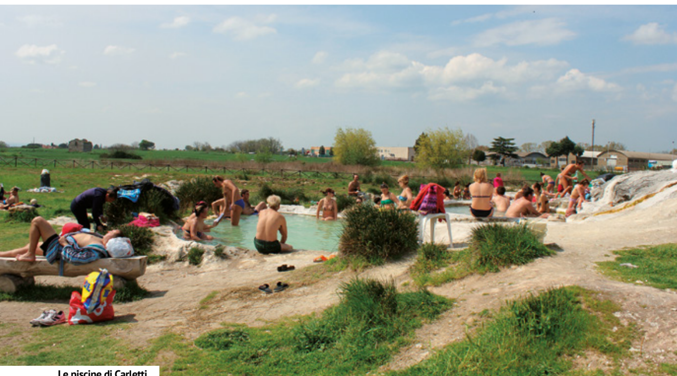
Le piscine di Carletti

A dicembre, immancabili i presepi viventi e i mercatini di Natale. A gennaio, la festa di Sant'Antonio è una delle più sentite. Ricordiamo con entusiasmo quelle di Canino, di Bassano Romano e Sutri. Ma ce ne sono molte altre. In primavera si va dalle tradizionali rappresentazioni della Settimana Santa agli eventi della tradizione