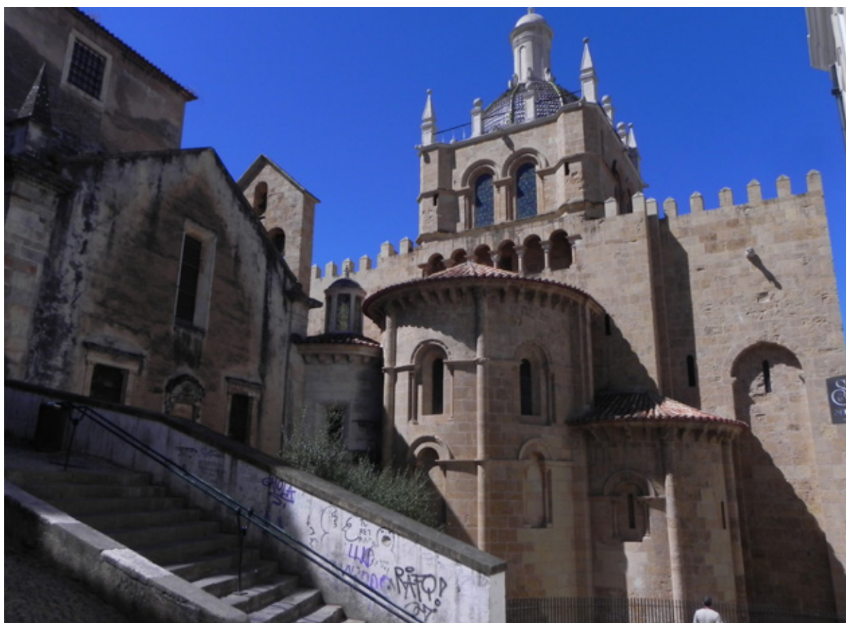
Il retro della cattedrale di Coimbra

Veramente comoda quest'area che permette ai camperisti di avere a pochi passi i servizi del parco: una piscina, servizi, ristorante, area giochi e attrezzi da palestra. In pochi minuti, attraversato il ponte sul fiume