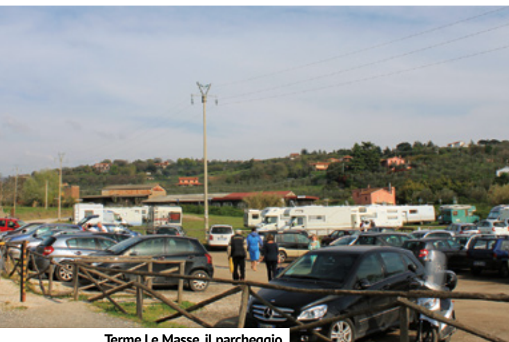
Terme Le Masse, il parcheggio