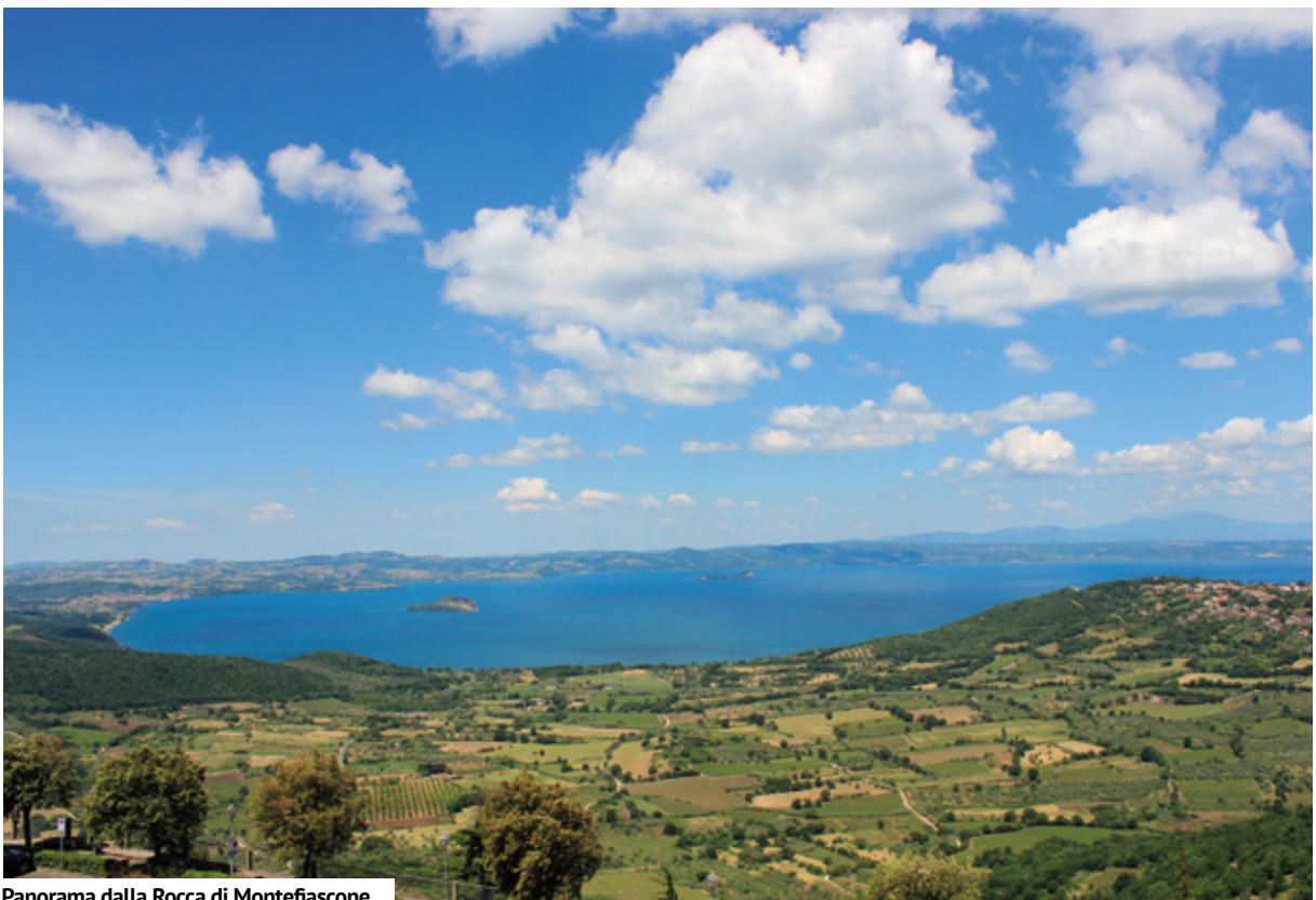
Panorama dalla Rocca di Montefiascone

Durante il nostro soggiorno abbiamo tralasciato gli stabilimenti termali privati, preferendo le terme cosiddette "libere", o quasi. Quattro i siti visitati: il Bullicame,