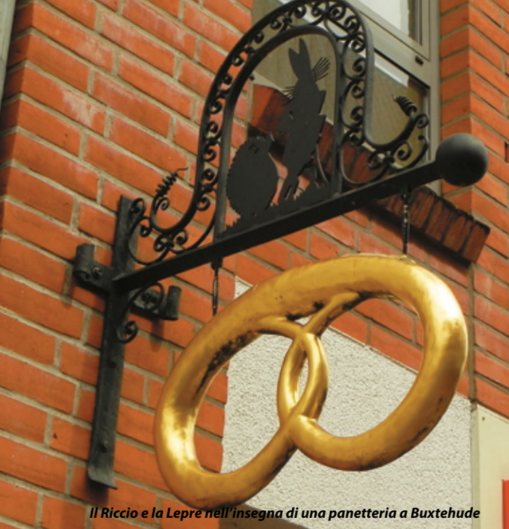
Il Riccio e la Lepre nell'insegna di una panetteria a Buxtehude