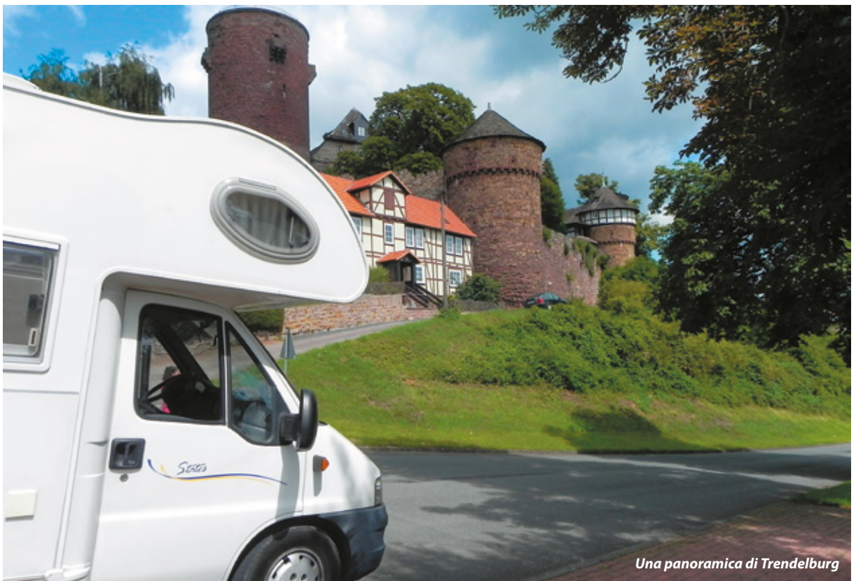
Una panoramica di Trendelburg

domenica da aprile a ottobre alle 15 esce Raperonzolo che concede autografi insieme al suo principe (adulti 3 euro, bambini da 6 a 12 anni 1,50 euro). Pare che l'edilizia poco opportuna sia di casa anche qui: una casa costruita quasi a ridosso delle antiche mura, una vera bruttura che disturba la vista dal basso del Castello! Ci divertiamo un po' a fotografarci mentre tocchiamo la treccia, ma presto ripartiamo alla volta di Oberweser. Abbiamo qualche difficoltà a raggiungerlo, poiché nel nostro navigatore non appare nella lista delle località; così aggiriamo l'ostacolo cercando tra i punti d'interesse dove scoviamo un campeggio, che si trova proprio fuori la cittadina, simbolo di ben due fiabe: Biancaneve e il Gatto con gli Stivali (Schneewittchen e Der gestiefelte