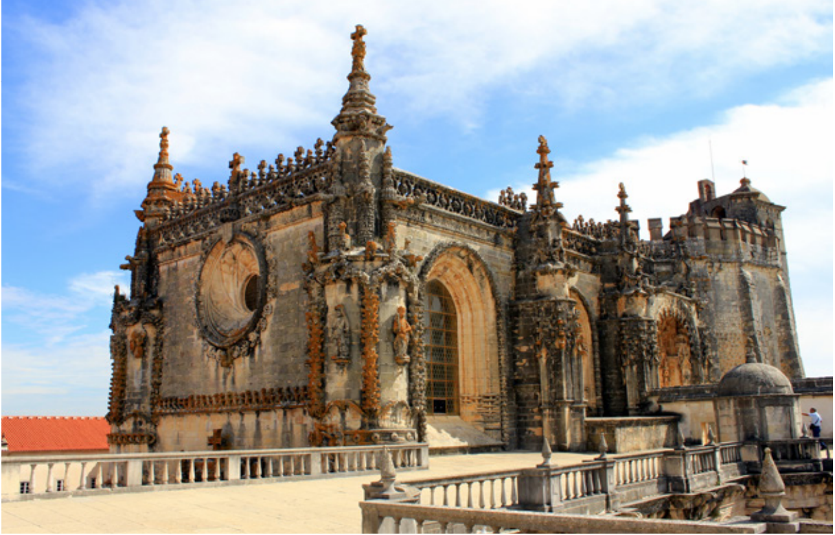
Tomar, la città templare: Convento dos Cavaleiros de Cristo, monumento considerato dall'Unesco "Patrimonio dell'Umanità"