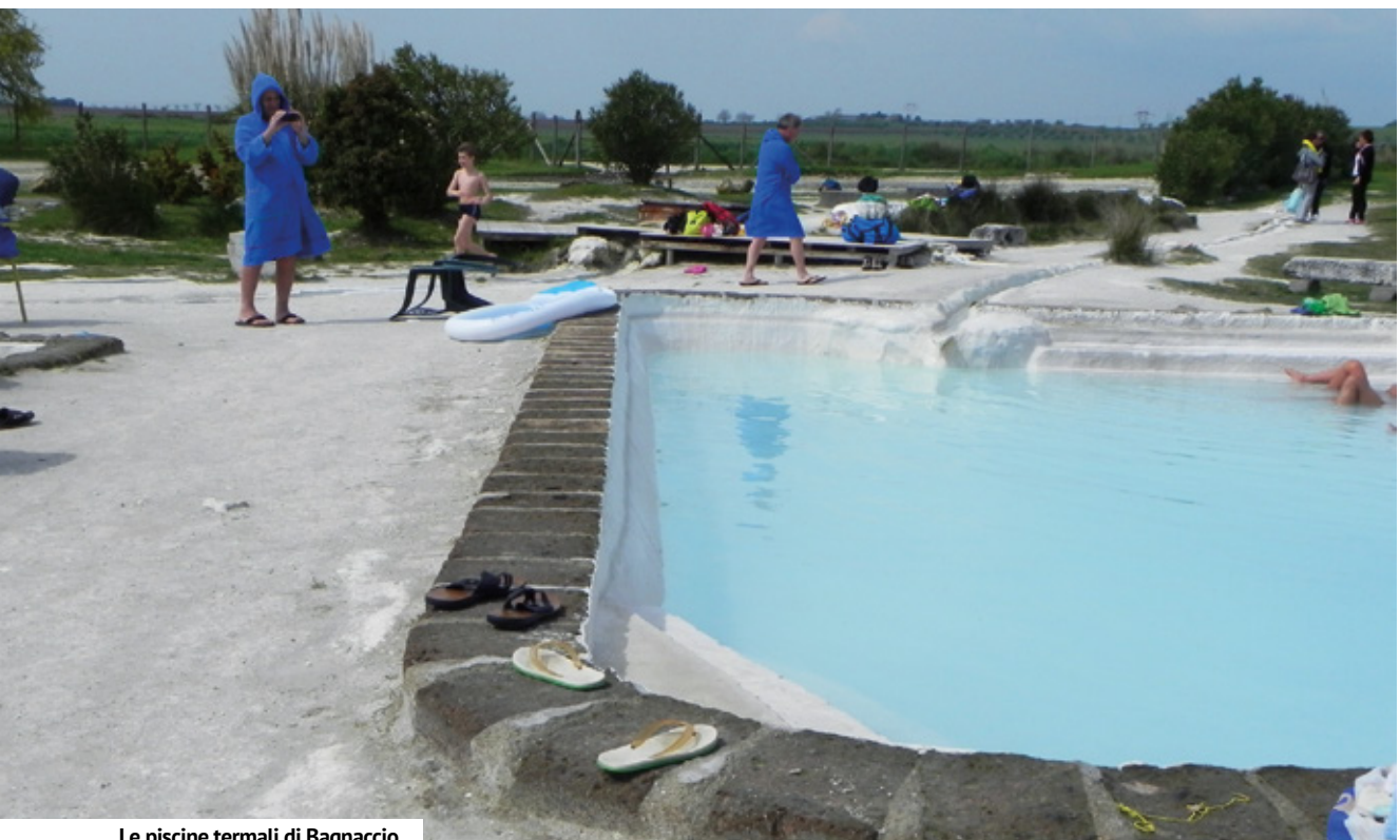
Le piscine termali di Bagnaccio

L'angolo più affascinante della città è senz'altro il quartiere San Pellegrino, dove, tra viuzze e scorci da cartolina, ogni anno, agli inizi di maggio, si svolge la manifestazione "San Pellegrino in fiore": un susseguirsi di eventi di vario genere incorniciati dal tripudio di fiori e piante che addobbano meravigliosamente il quartiere. Viterbo annovera tra le tante eccellenze la Macchina di Santa Rosa, divenuta patrimonio UNESCO nel 2013, che ogni anno, la sera del 3 settembre, richiama curiosi e devoti. I cosiddetti Facchini di Santa Rosa portano a spalla questa Macchina, che di anno in anno viene ri-