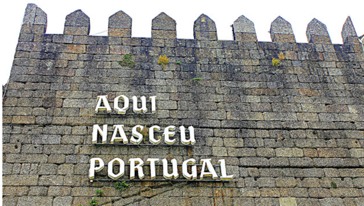
Guimarães, la città simbolo della nascita del Portogallo. Qui venne combattuta la battaglia di S. Mamede, decisiva per l'indipendenza

A bbiamo scelto fra molte indecisioni le nostre prime vacanze in Portogallo. Non mi sembrava affatto una buona idea, e così, nella pianificazione del viaggio, le inevitabili soste in Francia e Spagna hanno occupato un ampio spazio temporale. In questo diario non mi dilungherò sulle soste fatte durante i viaggi di andata e ritorno, ma solo sulla splendida permanenza in Portogallo, che si è rivelato inaspettatamente meritevole e, potendo tornare indietro, programmerei privilegiando questa variopinta nazione. È sicuramente una meta meno frequentata dai turisti itineranti, tanto che anche nel mese di agosto non abbiamo mai avuto problemi di sosta e mai abbiamo trovato i posti visitati sovraffollati. Il portoghese non è immediatamente comprensibile per chi non ha proprietà della lingua e, in tema di possibili problematiche, c'è da precisare che il sistema automatico del pagamento di alcune autostrade può creare difficoltà. Molto vantaggioso il costo della vita, parecchio più basso rispetto al nostro e diverso è anche il ritmo della vita. Sembra quasi che il tempo passi più lentamente qui, molto differente dall'atmosfera frenetica cui siamo abituati. Sotto alcuni aspetti mi è sembrato di essere catapultata con un viaggio a ritroso nel