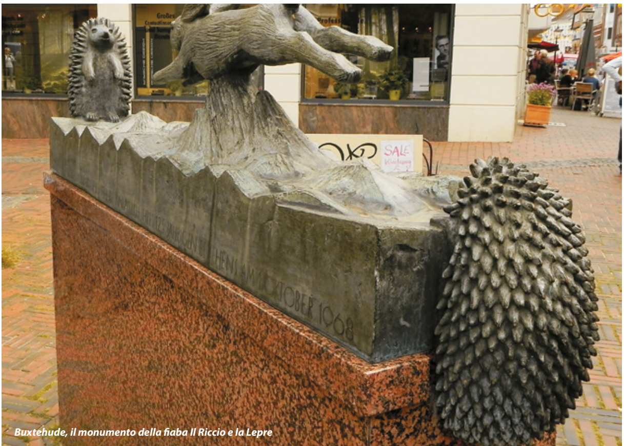
Buxtehude, il monumento della fiaba Il Riccio e la Lepre

Buxtehude sembra essere poco visitata dagli italiani e ha proprio l'aspetto di un paesino da fiaba; non a caso il motto della città: "Furbo chi c'è già" («Schlau, wer schon da ist!»), palese riferimento alla qualità della vita. Piccolo avviso: in questo, come in molti altri piccoli centri, ci sono zone in cui possono circolare anche le auto (oltre ai pedoni e alle bici), zone