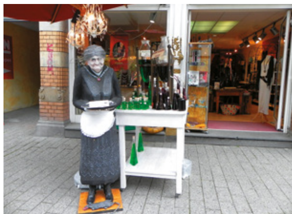
Hameln, il liquore RattenKiller (Ammazzatopi) e la statua del Pifferaio Magico

Appena svegli notiamo una temperatura esterna di 14° e, come da programma, visitiamo il magnifico Duomo. Uscendo, è d'obbligo un po' di shopping al mercatino: nei nostri viaggi non trascuriamo mai l'aspetto gastronomico. La giornata è solo agli inizi e, carta tematica alla mano, arriviamo ad Hameln, la città del Pifferaio Magico (Der Rattenfänger). Ci posizioniamo nell'area attrezzata Hannes Weserblick, a poche centinaia di metri dal centro (3 euro per le prime 3 ore, 1 euro/ora per le ore successive, 8 euro/24 ore, acqua 1 euro/100 l, scarico gratuito, elettricità 1 euro/8 ore; attenzione, l'inserimento prevede un minimo di tre ore, cui se ne possono aggiungere altre). Anche qui andiamo in centro con le bici e subito notiamo numerosi cartelli numerati: il "Percorso dei Topi" («Auf den Spuren des Rattenfängers»). È proprio a una leggenda su questo poco amato animaletto che la cittadina deve la sua notorietà; si deve tornare indietro di qualche centinaio d'anni quando, invasa dai topi, un tal pifferaio promise di liberarla incantandola con il suono del suo flauto. Il bravo pifferaio riuscì nella sua impresa e i topi lo seguirono, ma quando si vide rifiutare la ricompensa promessa, adirato, suonò di nuovo il suo flauto: questa volta lo seguirono tutti i bambini di Hameln, che sparirono.