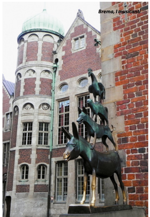
Brema, i musicanti

semi di papavero e i ribes freschissimi! Dopo un veloce pranzo, partiamo alla volta di Brema. In centro si potrebbe entrare solo con la Plakette verde, ma è consentito il transito alle autocaravan che ne sono sprovviste solo se diretti verso l'area di sosta. Arrivati nell'area Am Kuhhirten (10 euro/notte e si deve uscire il giorno successivo entro le 14; elettricità 0,50 euro/1kw, scarico gratuito, carico 1 euro/100 l. oppure 10 cent/10 l.; 5 minuti in bici dal centro; attenzione, bisogna avere monete da 50 cent per l'elettricità), ci sistemiamo e intorno alle 18 usciamo in bici. Nel magico percorso, Brema è la città dei Musicanti (Bremer Stadtmusikanten); troviamo subito il monumento ai quattro animali, ma quello che ci colpisce è la bellezza del Rathaus (il Municipio), il Roland (la statua del Rolando), la Böttcherstraße (Strada dei Bottai, i quali vissero e lavorarono in questa strada dall'architettura veramente particolare, che fu un importante collegamento tra il fiume Weser e la piazza del mercato centrale della città di Brema), lo Schnoorviertel (il quartiere storico di Schnoor), il Seute Deern (l'ultimo veliero in legno). Il Duomo di San Pietro (St. Petri Dom) lo rimandiamo a domani dopo una bella dormita provvidenziale, vista la giornata così intensa, che concludiamo con un'ottima cena in stile bavarese all'Hofbräuhaus.