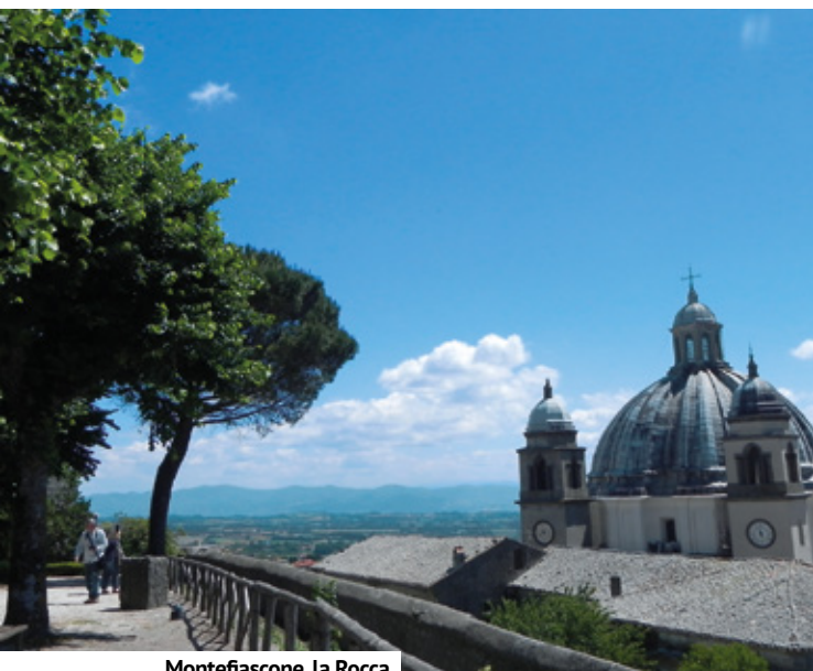
Montefiascone, la Rocca

le Piscine Carletti, il Bagnaccio e le Pozze di San Sisto. Tutte in un raggio di circa quindici chilometri. Da precisare che prima di beneficiare delle acque, soprattutto in caso di presenza di patologie, è sempre consigliato, doveroso e indispensabile consultare un medico.