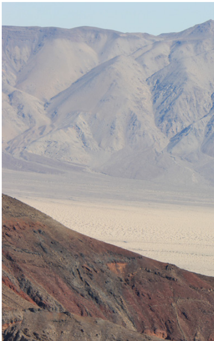
Maestoso panorama della Death Valley

Center; la temperatura quando entriamo è di 84°F (circa 29°C) mentre all'uscita notiamo che si è alzata ancora di qualche grado! A questo punto abbandoniamo la 190 e imbocchiamo la Bad Water Road, arrivando fino alla fine per scattare qualche foto alla Bad Water: l'acqua cattiva (detta così perché non potabile). È la depressione più bassa del Nord America, 86 metri sotto il livello del mare, ricchissima di sali minerali, tanto che intorno si cammina praticamente sul sale! Sempre sulla stessa strada ci sono due percorsi degni di nota: il