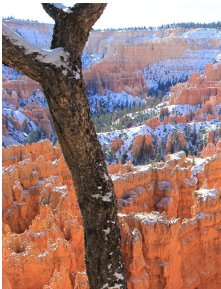
Il Bryce Canyon

Meno chilometri, ma sicuramente un percorso più impegnativo: attraversiamo addirittura lo Zion National Park ( http://www.nps.gov/zion/index.htm - GPS 37.201879,-112.988385)! Tutto sommato non ci dispiace, anche se è