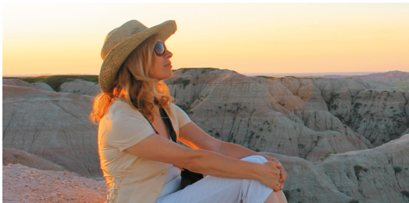
Badlands National Park, Sud Dakota

Vedere le Badlands al tramonto è stata una fortunata circostanza: sembrano ancora più magiche e misteriose, decisamente indimenticabili e irrimediabilmente destinate a essere ricordate con