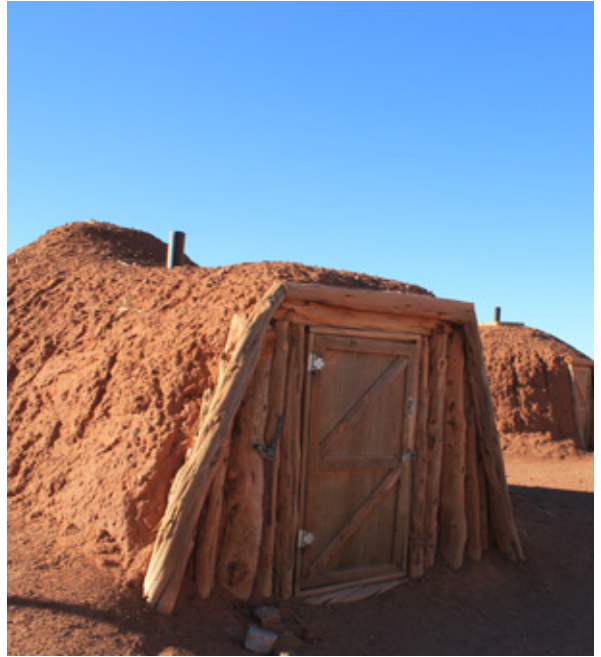
Le Hogan, tipiche case Navajo