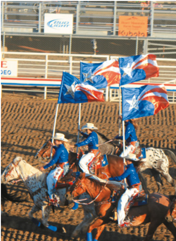
Il Cody Nite Rodeo, Cody, Wyoming

Washakie chiese che una parte dell'acqua termale