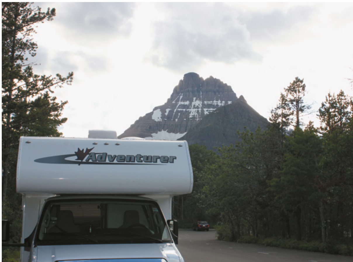
Glacier National Park, la nostra autocaravan vicina al punto di partenza del Swiftcurrent Nature Trail

Siamo nel Montana, detto anche Big Sky Country , (lo stato dal grande cielo), o Treasure State , (lo stato del tesoro).