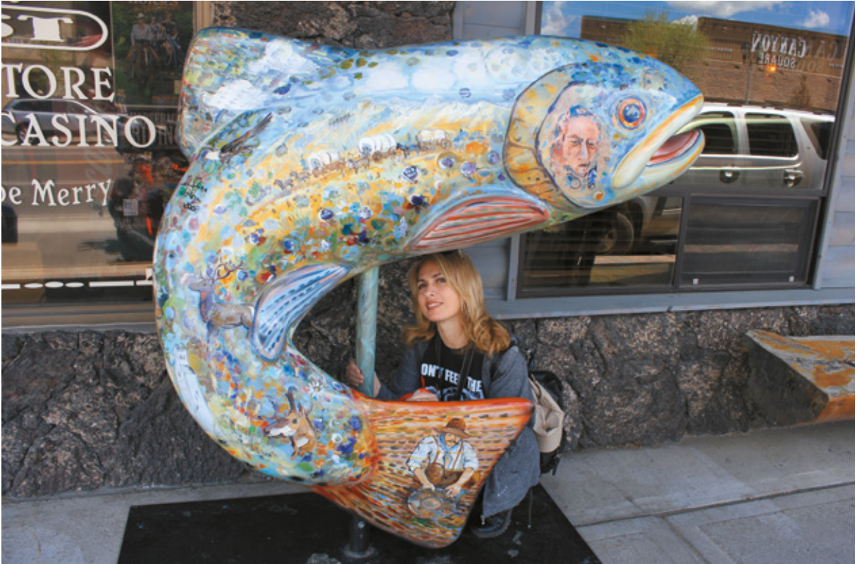
Passeggiando a West Yellowstone, Montana