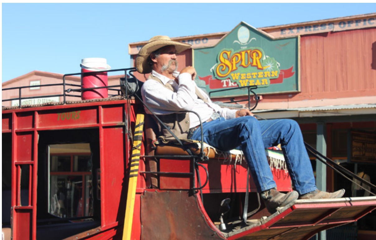
La diligenza di Tombstone

appuntamenti, un teatro e un saloon. Ambienti rimasti intatti dove ogni giorno vengono organizzati dei tour alla scoperta dei fantasmi, che molti hanno riferito di aver visto. Saltiamo la visita al cimitero, dove sulle tombe, oltre alle generalità e alla data di morte, è indicato anche il nome di chi ha ucciso la persona che è sepolta. Ci fermiamo per qualche foto alla Wyatt Earp House & Gallery, la casa del celebre sceriffo, oggi convertita in galleria d'arte. Per noi ogni angolo è una scoperta, ci sentiamo catapultati in un'altra epoca. Ci dispiace un po' non assistere a neanche uno spettacolo, ma dobbiamo essere entro questa sera al confine con il Messico e ci aspettano circa seicento chilometri.