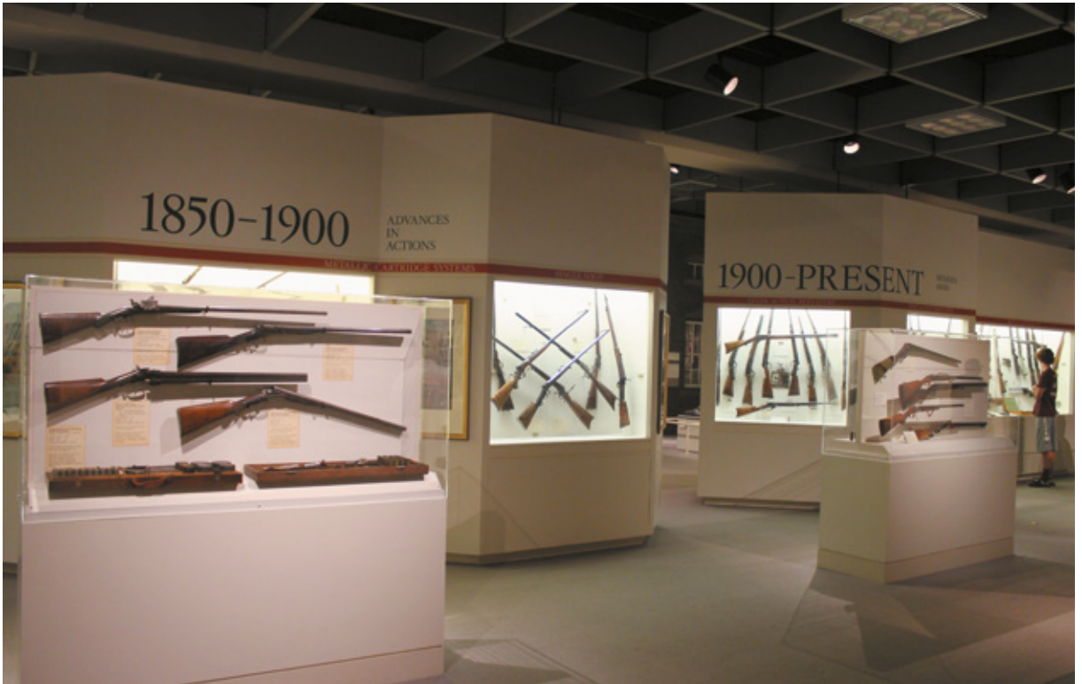
Il Firearms Museum nel Buffalo Bill Center of the West, Cody, Wyoming

ielli, ma anche grandi, come automobili e diligenze. Fino al “pezzo” più grande, la “ Boyhood Home ” di William F. Cody, la sua casa d’infanzia.