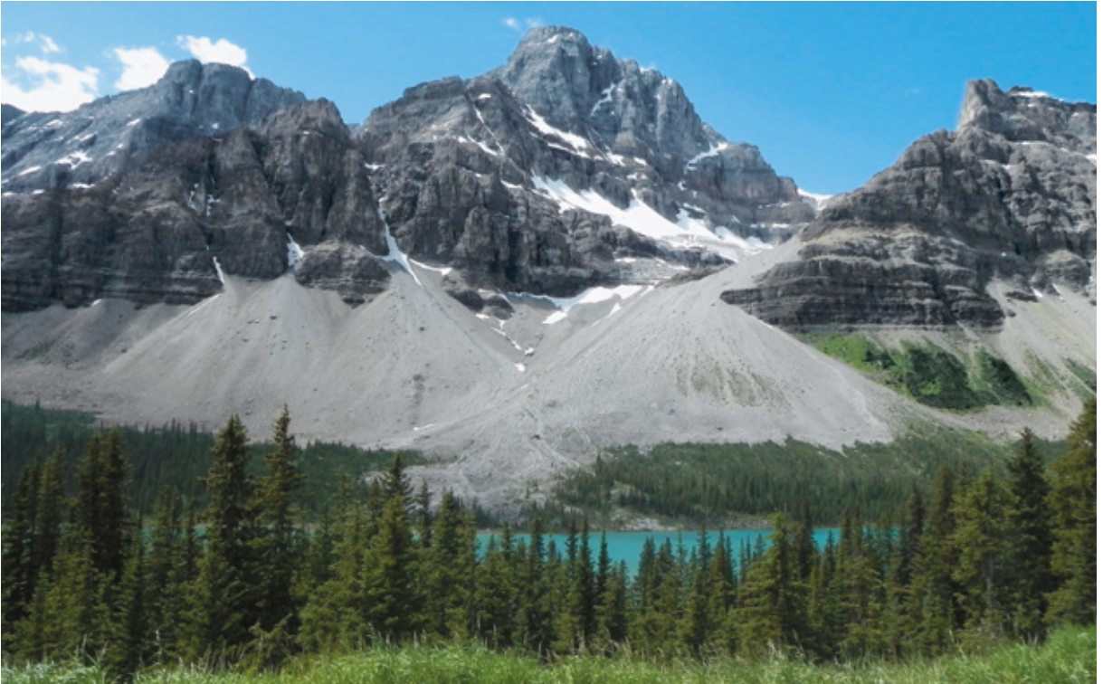
Bow Lake, Alberta, Canada

Da quando gli europei approdarono la prima volta in America a oggi, molti spazi sono stati occupati da immensi grattacieli e da popolose aree metropolitane, ma noi ci siamo un po' allontanati dalla modernità e per questo viaggio abbiamo scelto come destinazione la Real America . Così è abitualmente chiamata quella porzione di territorio che comprende gli stati del Montana, Wyoming, Sud e Nord Dakota.