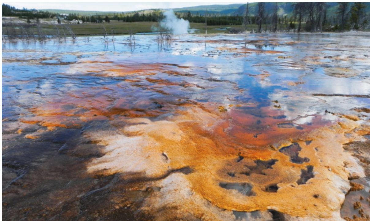
Biscuit Basin, Yellowstone National Park, Wyoming

spazzando via enormi rocce che circondavano il cratere.