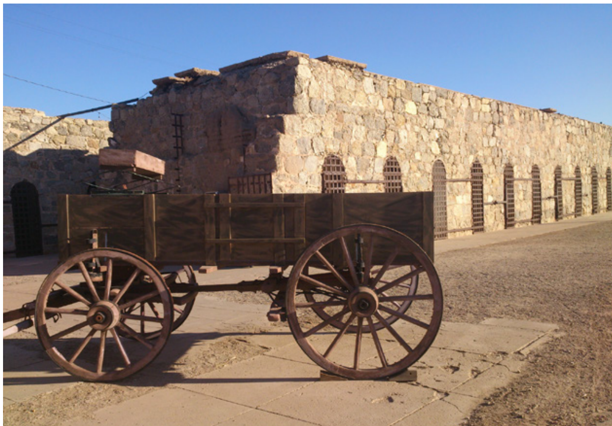
La Yuma Territorial Prison

viste tante autocaravan tutte insieme, sembrano non finire mai! Proviamo a contare quelli di una sola area ma non è possibile, le lunghe file di mezzi parcheggiati si perde all'orizzonte. È una città ben nota ai camperisti americani, che arrivano qui ogni anno dal Nord per passare qualche mese lontani dai rigori invernali dei loro paesi. Sono chiamati "snowbirds", e ogni anno volano via dalle gelide neviccate del Nord per bearsi delle temperature meno rigorose di questa fascia di terra.