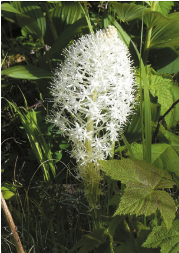
Beargrass, l'erba preferita dagli orsi, al Glacier National Park