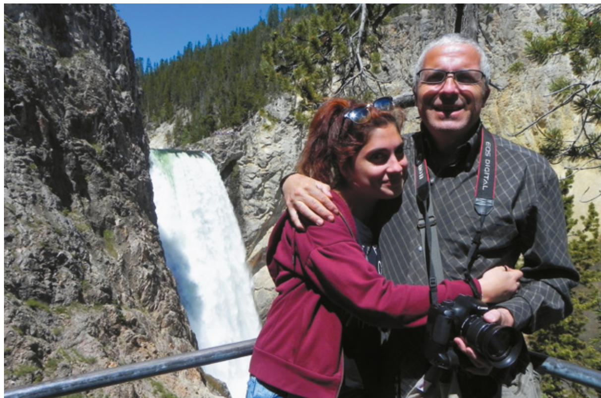
Le Lower Falls in fondo al percorso chiamato "Uncle Tom's Trail", Yellowstone National Park, Wyoming

Dal belvedere una suggestiva panoramica sulle Lower Falls , che oggi un arcobaleno rende ancor più belle. Da qui ci spostiamo all' Artist Point , dove per un attimo temiamo di non trovare uno spazio