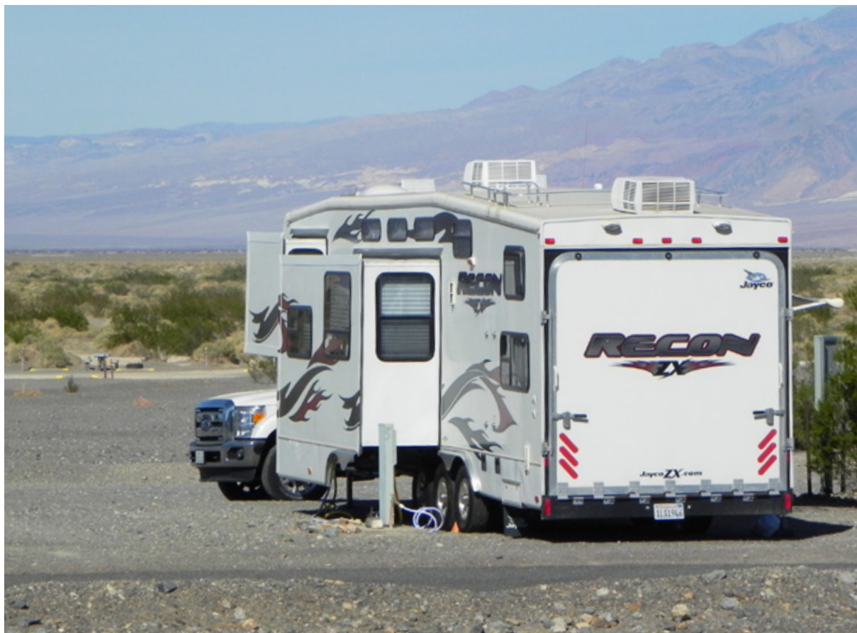
RV (recreational vehicle, veicolo da svago) allo Stovepipe Wells RV Park & Camping