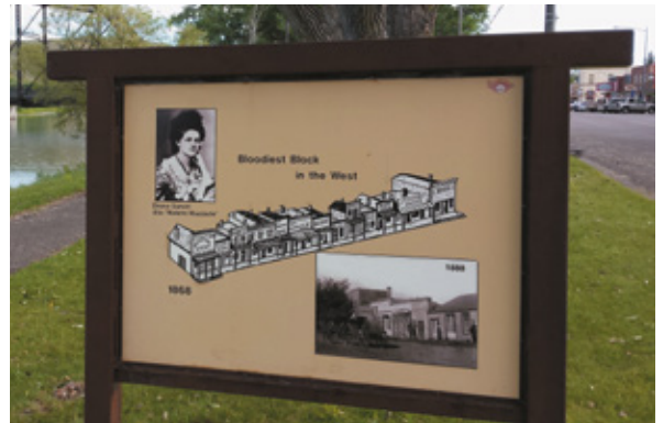
A sinistra, monumento dedicato al cane Shep, Fort Benton, Montana. In alto a destra, George Montgomery, Rider of the Purple Sage, Fort Benton, Montana. Sotto, il quartiere più sanguinoso del West nel 1868, Fort Benton, Montana

Era arrivato a Fort Benton nell'estate 1936. Il suo padrone, un pastore di pecore, si era ammalato e così pensò di farsi curare nella città. Il suo cane, Shep, lo accompagnò. Quando il pastore morì pochi giorni dopo, il suo corpo fu posto in una bara e spedito ai parenti. Il povero cane, di razza Border Collie , seguì la bara fino al deposito dei treni, e rimase a guardare mentre si allontanava. Per quasi sei anni, Shep frequentò ogni giorno la stazione, sperando che da uno di quei quattro treni che puntualmente effettuavano lì una fermata scendesse il suo padrone. Il 12 gennaio 1942 non riuscì a sentire il treno delle 10.17: era troppo malato e sordo e non si spostò in tempo. Divenne famoso all'epoca e lo è anche ora. Subito dopo il monumento del Cane Shep si trova l'ufficio turistico, fortunatamente ancora aperto. Due simpatiche signore ci suggeriscono di fare una passeggiata sul lungo fiume. Dopo aver chiacchierato un bel po' e aver saccheggiato l'ufficio di molti opuscoli, facciamo