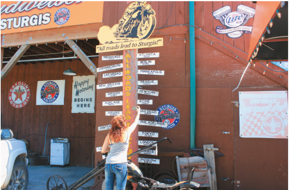
"Tutte le strade portano a Sturgis", nei pressi del Knuck Saloon City, Sud Dakota

mo comunque penalizzati per questo: c'è ancora possibilità di vedere gli spettacoli più importanti. Deadwood, una volta grande centro minerario, ha acquisito nell'era moderna una notorietà che l'ha trasformata in una delle mete più famose del Sud Dakota. Più di un secolo fa la gente arrivava qua con la prospettiva di ricchezza, attirata dall'oro e dal gioco d'azzardo. Le spartorie erano una consuetudine e la sua storia è costellata da personaggi coloriti, miticizzati e spesso avvolti ancora nel mistero. Wild Bill Hickok , un nome che è leggenda. Protagonista indiscusso durante i memorabili anni del selvaggio West, James Butler Hickok amava farsi chiamare Wild Bill . Durante la sua breve vita - 1837/1876 - il suo nome echeggiò tra le cittadine più sanguinose e malfamate dell'Ovest, dove era famoso per la sua capacità di mantenere la calma nei duelli, riuscendo così a mirare contro l'avversario con incredibile precisione.