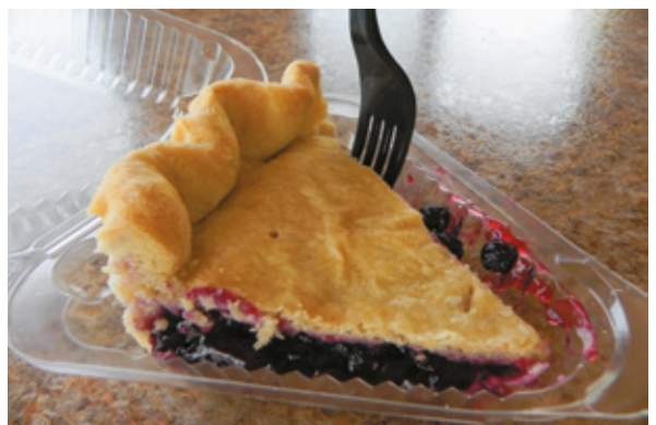
Huckleberry Pie a West Glacier, Glacier National Park