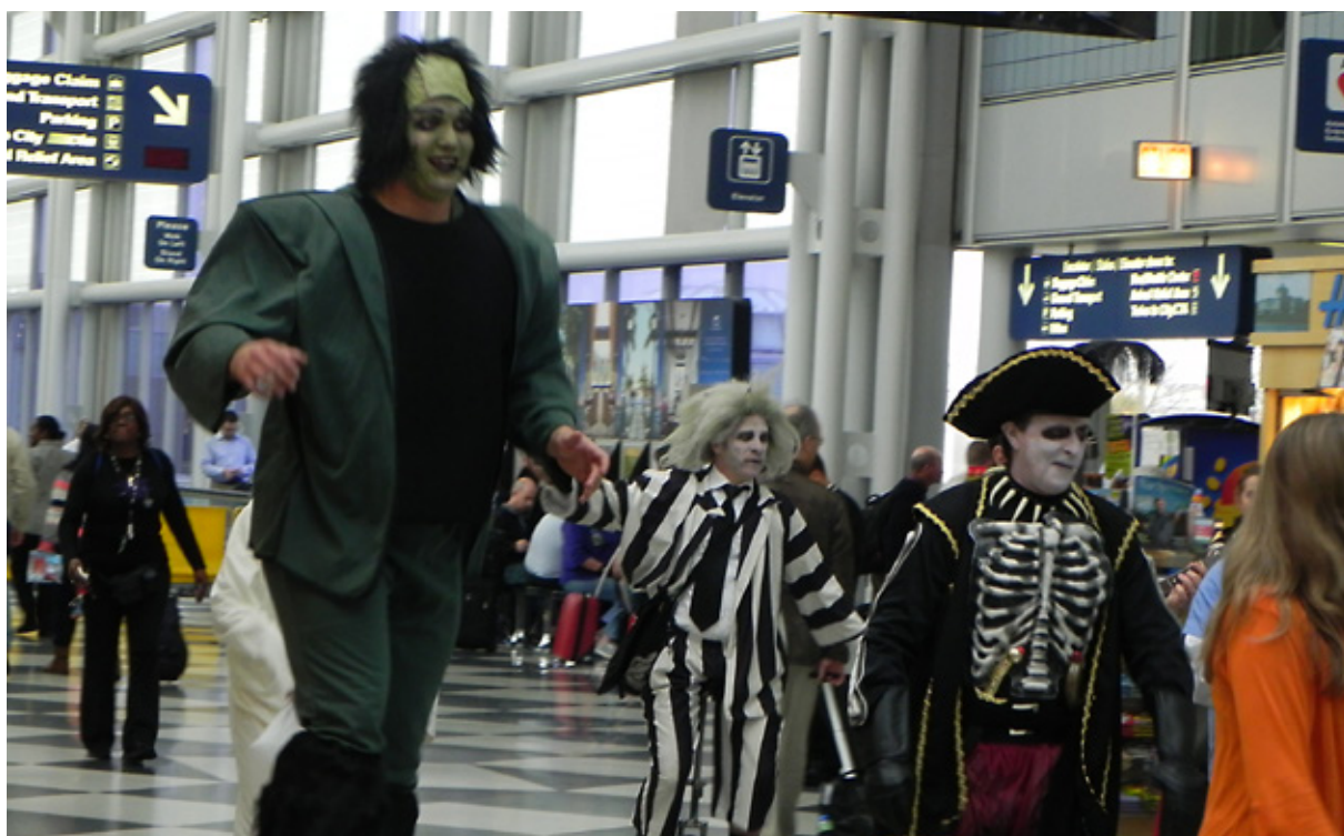
Halloween all'aeroporto di Chicago

Importantissima è poi l'assicurazione sanitaria. Soprattutto negli Stati Uniti, anche un piccolo infortunio può causare il pagamento di migliaia di euro alle strutture mediche; è bene quindi