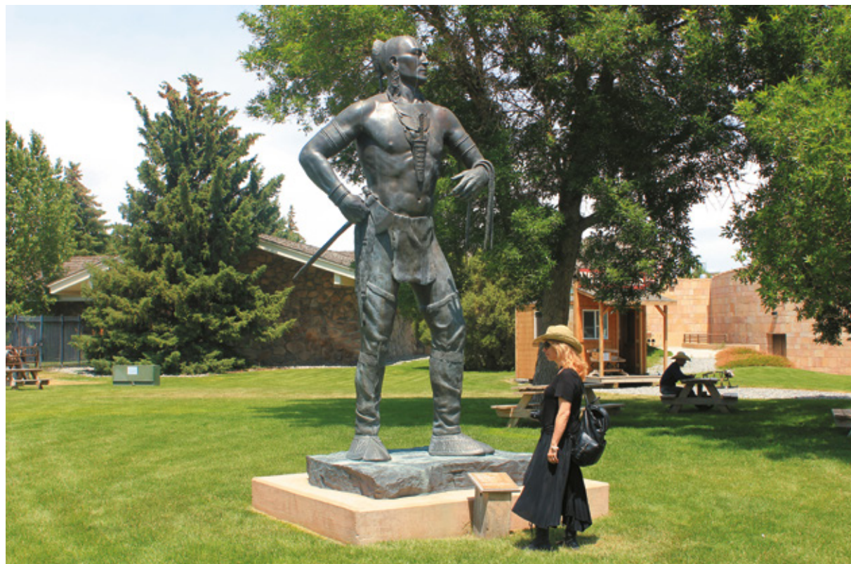
Nei giardini del Buffalo Bill Center of the West, Cody, Wyoming

Una collezione di più di 9.000 pezzi di varie dimensioni: oggetti piccolissimi, come anelli e gio-