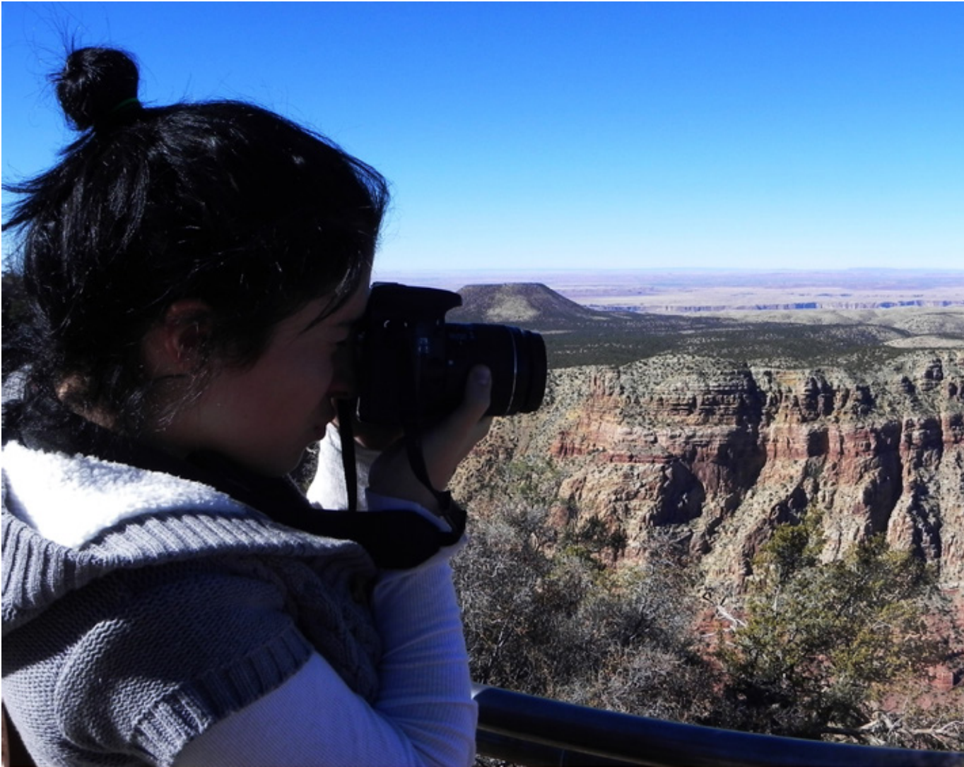
Panoramica del Gran Canyon

per presentare all'East Entrance il nostro Annual Pass e ricevere il materiale informativo, in alternativa il costo è di 25 dollari per ogni veicolo (GPS 36.036156,-111.830141 - http://www.nps.gov/grca/index.htm - da questo link sono scaricabili anche le informazioni in italiano). Questo Parco è grandissimo, e vederlo tutto in poche ore è impossibile; noi, con una permanenza di sole tre ore, riusciamo a compiere una buona visita. La zona è quella del South Rim, più comoda per il nostro tracciato. Quanto a organizzazione turistica è sicuramente uno dei migliori: bus navetta gratuiti con tanto di portabici, rampe per sedie a rotelle, programmi di escursioni e molto altro. Noi iniziamo dal