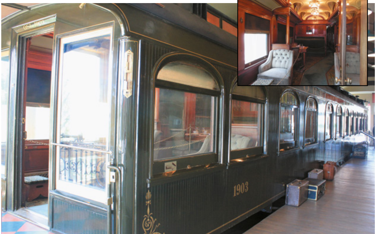
Nelle immagini, vagone ferroviario dell'Oregon Short Line 1903, West Yellowstone, Wyoming

Ogni tavolo si trova all'interno di carrozze in un'atmosfera da Vecchio West, con pareti dipinte, luci soffuse e gli animali tipici della zona al centro della stanza (naturalmente finti!).