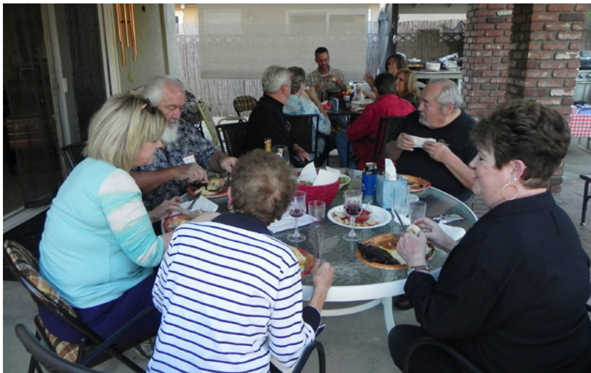
Indimenticabili momenti con la famiglia: arrivati da ogni angolo della California per il nostro party

(servizio che nelle lunghe tratte è per lo più compreso). Le porzioni non sono abbondanti, ma l'inevitabile immobilità durante il percorso rende tutto più che sufficiente.