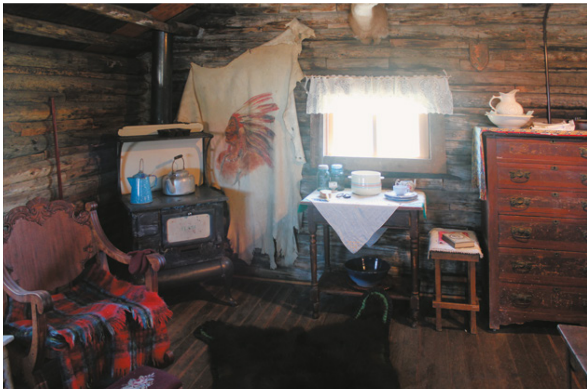
Fremont County Pioneer Museum, Lander, Wyoming

che ora fa, ma dobbiamo tentare. Finalmente troviamo in un grande piazzale sia il pozzetto per lo scarico, sia il rubinetto per il carico. C'è anche un attacco per il carico di acqua potabile a pagamento, utilizzato dai nativi che abitano le tante case mobili disperse nei campi dei dintorni, e che vengono a rifornirsi d'acqua con grandi contenitori di plastica caricati sui loro pick-up. Torniamo a Fort Washakie e rientriamo nella zona riservata al powwow . Fra poco inizierà il 56° Annual Eastern Shoshone Indian Days .