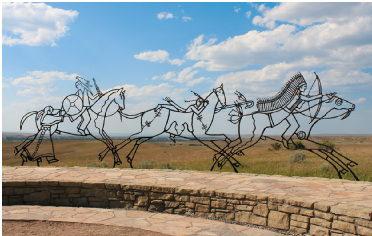
L'Indian Memorial a Little Bighorn, Montana