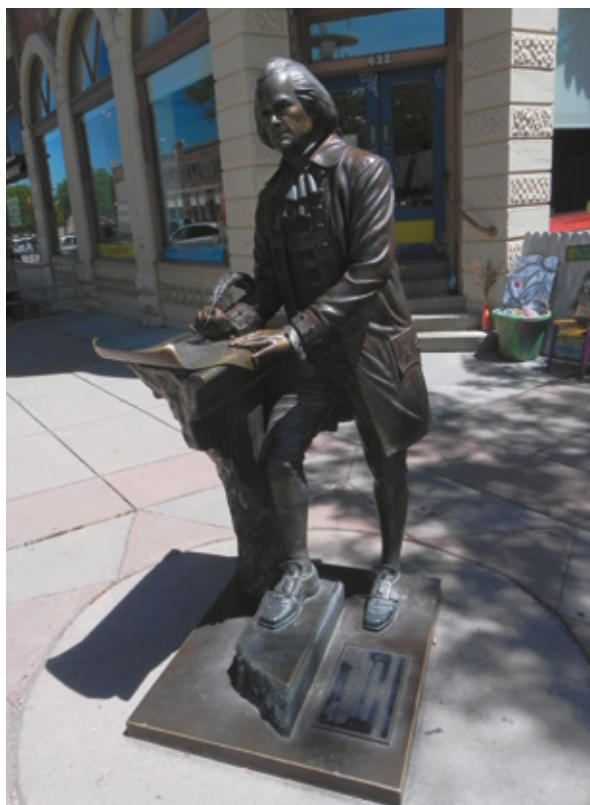
La statua di Thomas Jefferson nella Downtown, Rapid City, Sud Dakota