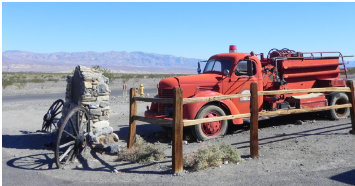
Death Valley: il Burned Wagon Point in ricordo dei cercatori d'oro che nel 1849 bruciarono i loro carri per cuocere la carne dei buoi