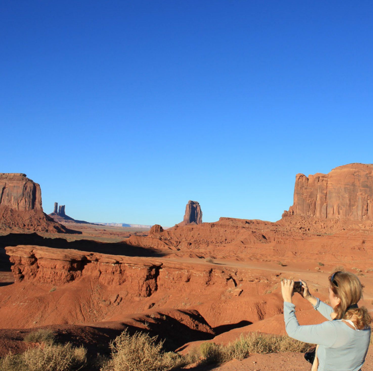
Spettacolare vista della Monument Valley

l'anno e dotato di camper service, e il Sunset Campground. Le guardie del parco, inoltre, organizzano gratuitamente escursioni in tutte le stagioni. Percorriamo tutta la Highway 63 fino al Rainbow Point, il miglior punto panoramico del parco, ma in questa stagione anche il più freddo: un vento gelido ci sfida, ma noi non desistiamo e restiamo fino al limite della