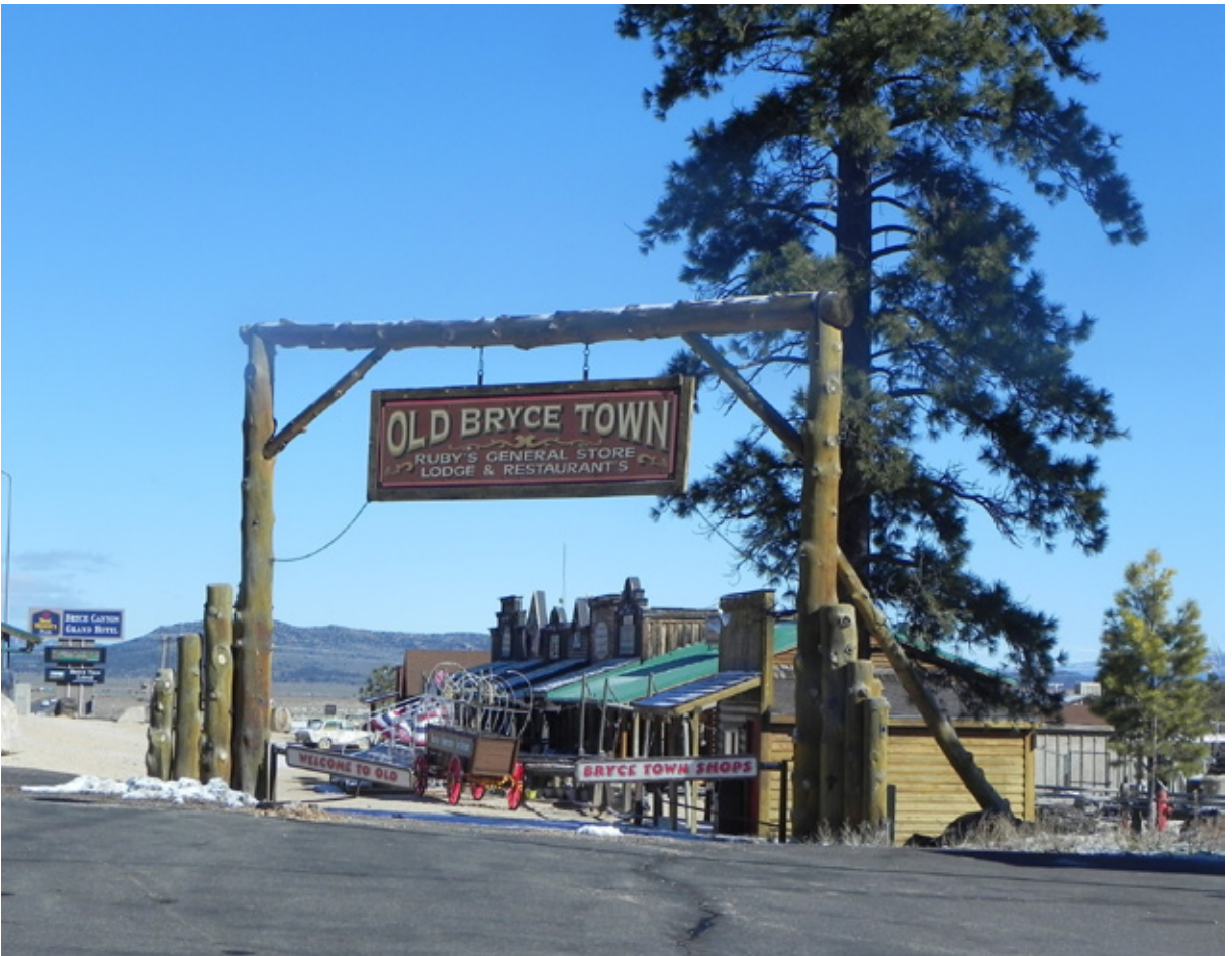
Old Bryce Town