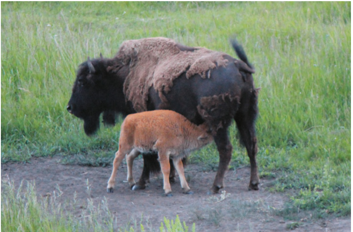
Attraversando la Lamar Valley, Wyoming

Whitney Western Art Museum , dove il tema principale delle opere è il mito del Vecchio West;