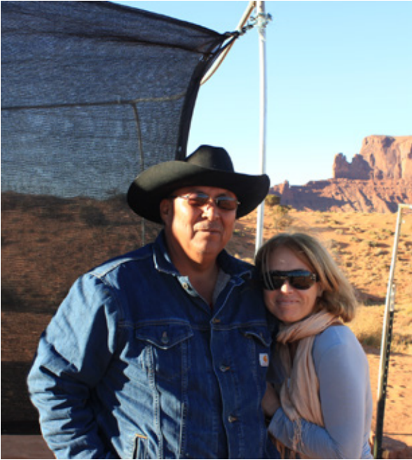
Con un Navajo autentico nella Monument Valley