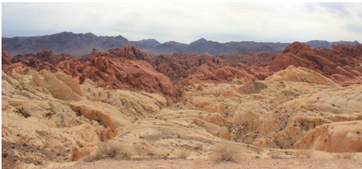
La Valley of Fire e i suoi colori

Con l'autocaravan è possibile trascorrere un periodo massimo di 14 giorni in uno dei due campeggi strutturati per accogliere fino a 72 veicoli. A disposizione di tutti i visitatori ci sono varie aree picnic e possibilità di fare escursioni. Naturalmente scattiamo un'infinità di foto che non sembrano mai abbastanza.