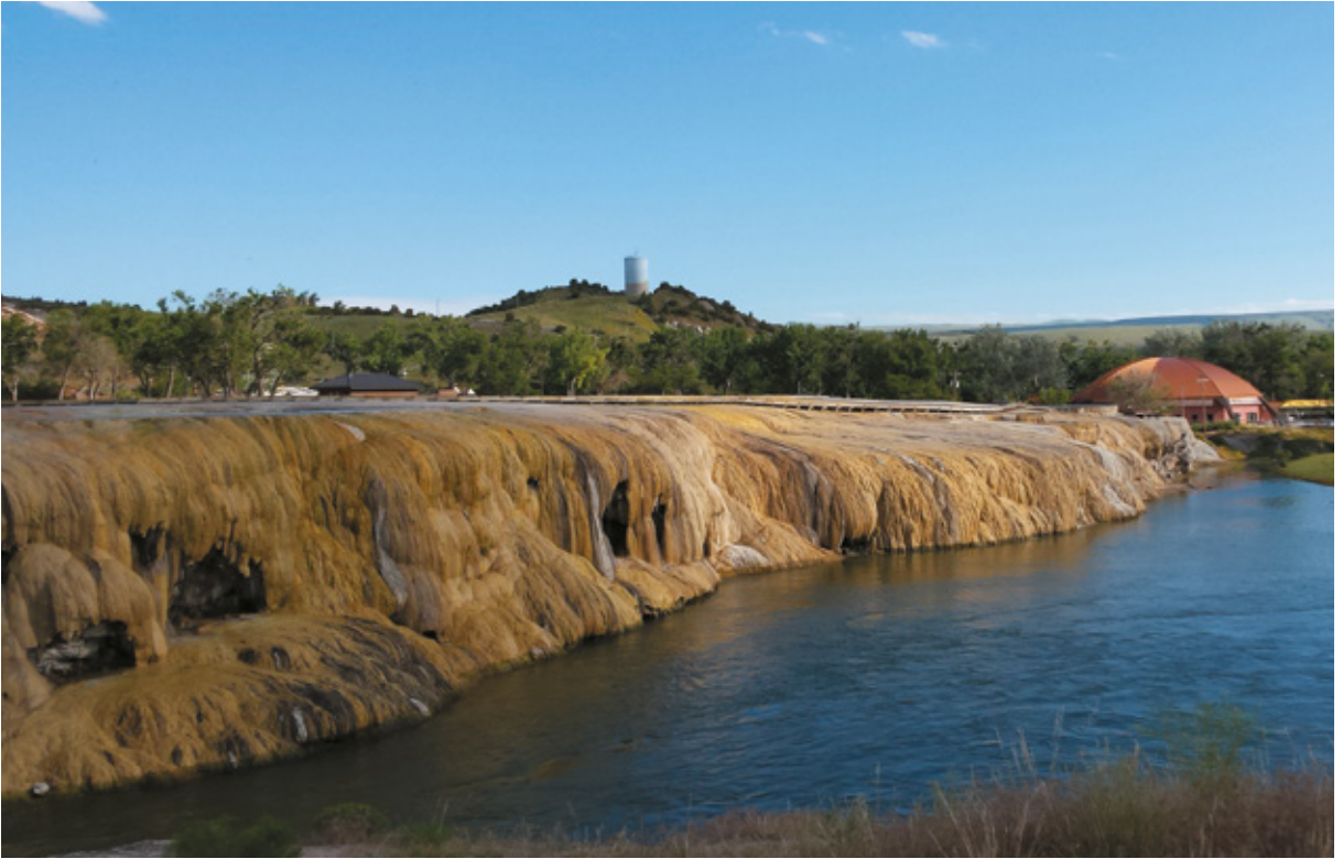
Vista dallo Swinging Bridge, Thermopolis, Wyoming

Arriviamo verso sera a Riverton e ci sistemiamo nel parcheggio Walmart . È molto tardi ed è impossibile cucinare a quest'ora. Così entriamo e compriamo un pollo arrostito e qualche vaschetta di cibo vario per un antipasto misto: ottima cena e un po' di connessione con il resto del mondo grazie alla Wi-Fi libera di un fast food .