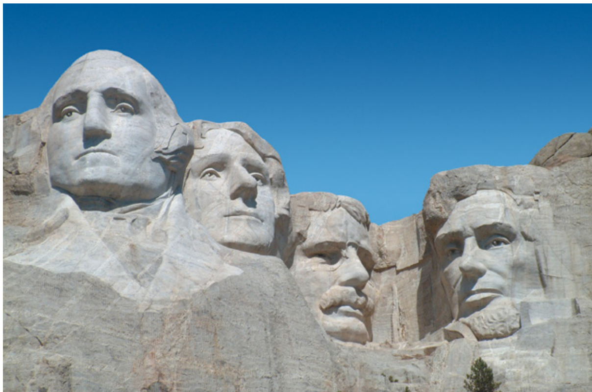
Mount Rushmore, i quattro presidenti scolpiti nella roccia, Sud Dakota

nonché una figura fondamentale tra coloro che gettarono le basi della democrazia americana ed è quello che spicca di più tra i quattro Thomas Jefferson, il terzo presidente degli Stati Uniti (1801/1809), fu il principale autore della Dichiarazione d'Indipendenza, che gli statunitensi vedono come il documento-guida per le democrazie di tutto il mondo.