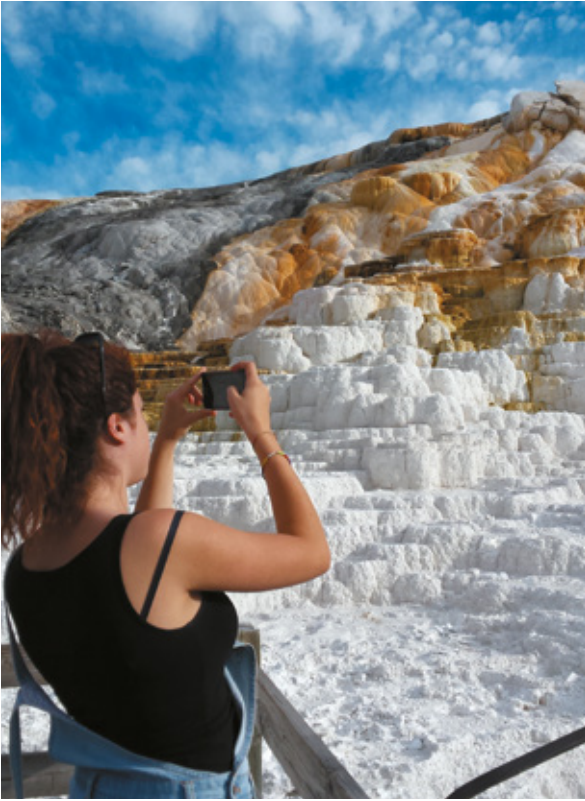
Mammoth Hot Springs, Yellowstone National Park

settori: Mammoth Hot Springs, Norris, Madison and West Yellowstone, Old Faithful, West Thumb and Grant Village, Fishing Bridge, Lake Village and Bridge Bay, Canyon Village, Tower-Roosevelt . Decidiamo di fare un giro ad anello, escludendo la Norris Canyon Road , la strada che taglia in due il cerchio della Grand Loop Road .