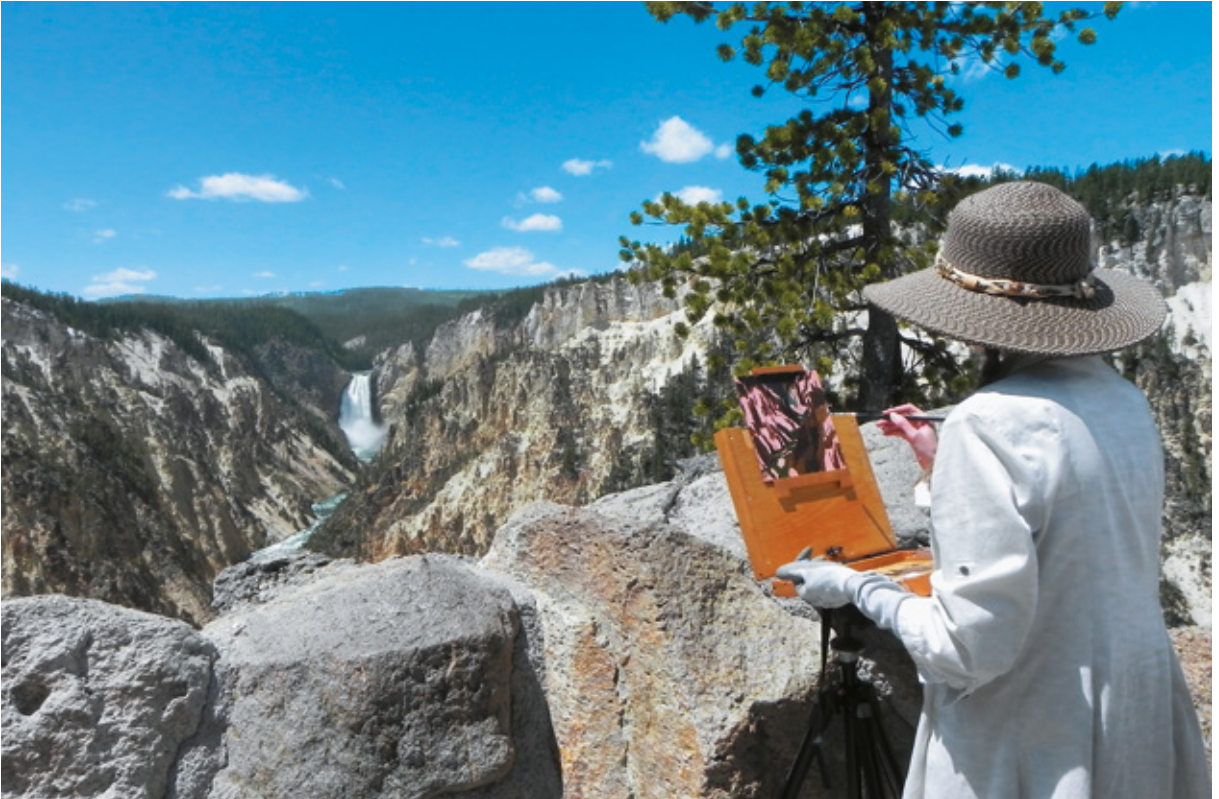
Pittrice all'Artist Point, Yellowstone National Park, Wyoming

per il parcheggio. Del resto questa del Canyon è una delle zone più visitate di Yellowstone. Dal parcheggio il punto panoramico dista solo 70 metri ed è accessibile a tutti. Il nome dice tutto, e infatti, troviamo una pittrice intenta a completare la sua opera. Di nuovo in autocaravan, torniamo indietro verso la Gran Loop Road , per poi girare dopo pochissimo sulla destra verso la panoramica Brink of Upper . Questo è il belvedere più vicino al “salto” delle Upper Falls .