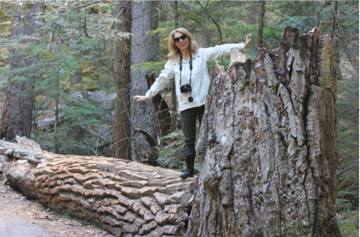
Lungo il Trail of Cedar, Glacier National Park