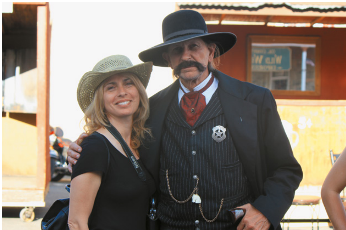
Uno dei "Gunfighters" dopo l'esibizione di fronte all'Irma Hotel di Cody, Wyoming

gozi, e, soprattutto, edifici e attività commerciali storiche come l'Hotel Irma. Hotel e ristorante, e oggi anche shop, che presero il nome dalla figlia di Buffalo Bill . Proprio lui aprì il locale il 18 novembre 1902 e lo chiamò come la figlia Irma.