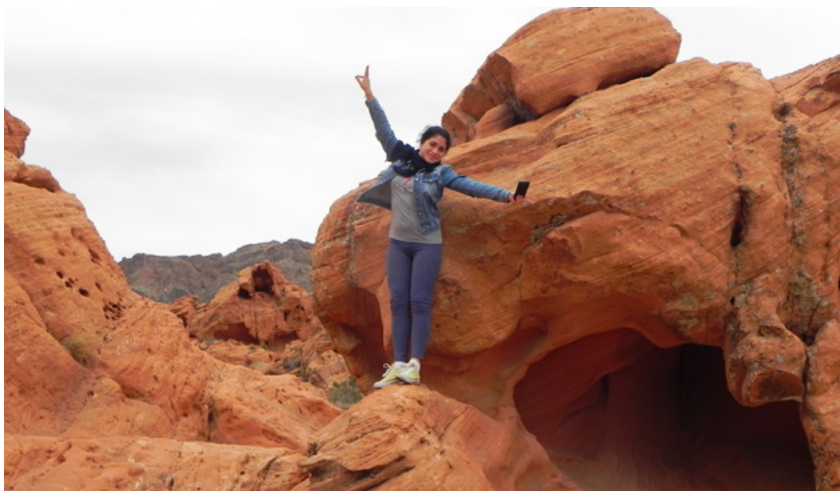
La Valley of Fire offre spunti per foto surreali