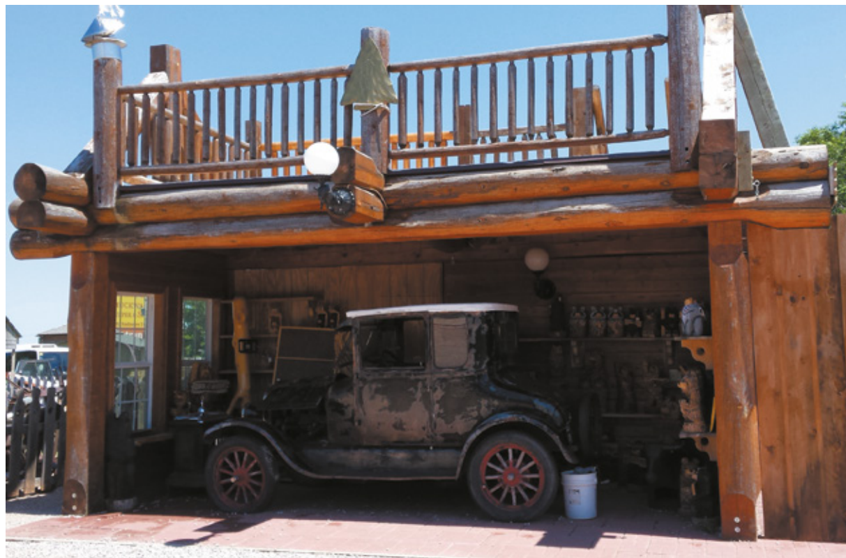
Fort Hays Old West Town, Sud Dakota

trova al confine tra le Black Hills e le grandi praterie. Non ci pensiamo due volte: aggiungiamo una tappa! Ogni anno, il primo fine settimana di agosto, vi si svolge lo Sturgis Motorcycle Rally , uno dei più importanti raduni motociclistici al mondo. Chiacchierando scopriamo che i residenti non arrivano a 7.000, ma nei giorni del raduno la città può arrivare a ospitare fino a 600.000 persone. Naturalmente non poteva mancare un museo a tema, lo Sturgis Motorcycle Museum , che non vediamo, perché preferiamo dedicare il poco tempo che abbiamo al percorso degli edifici storici lungo la Main Street e a una capatina in uno dei locali più importanti: il Knuck Saloon , dove ci invitano a visitare la Knuckle Brewing Company , un' apprezzata fabbrica di birra artigianale. Il Saloon sembra un museo, pieno com'è di pezzi d'epoca e cimeli: un po' stile Route 66 . All'esterno un'iscrizione recita: "Tutte le strade portano a Sturgis" indicando le distanze che lo separano da città americane ma anche europee. Pare che Roma disti 5.302 miglia da qui. Anche oggi abbiamo accumulato ritardo sul programma giornaliero, e arriviamo a Deadwood che sono le quattro del pomeriggio. Non sia-