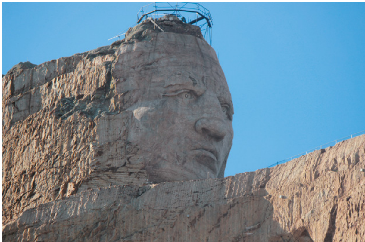
Il Crazy Horse Memorial, Sud Dakota

fermiamo a Custer, una graziosa cittadina con tanti locali tipici e un parco, con campeggio annesso, dedicato ai personaggi della serie di cartoni animati “ Gli Antenati ”, i Flinstones. Siamo in Sud Dakota, e l'animale-simbolo è il coyote mentre il fiore è la pulsatilla. Il motto, “ under God, the People rule ”, “(sotto la protezione di) Dio, il popolo governa”, è un chiaro riferimento ai cittadini che combatterono la guerra di Indipendenza per liberarsi dalla dominazione britannica. Ci fermiamo e compriamo un bel po' di sou-