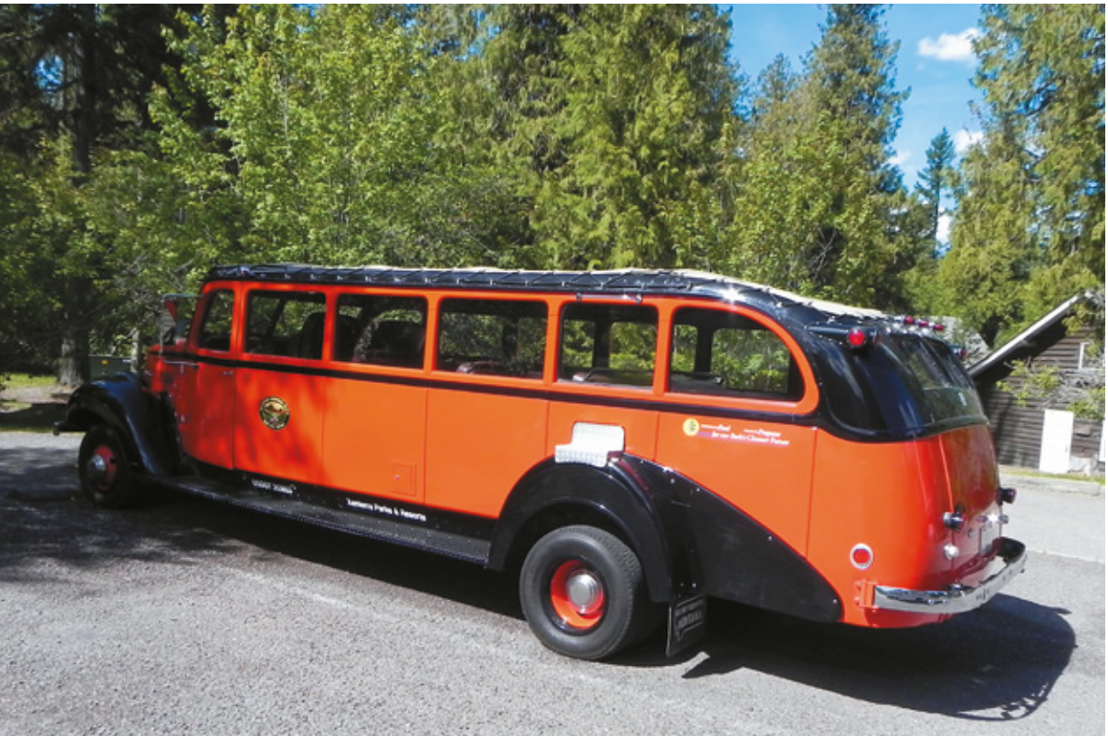
Uno dei numerosi bus turistici rossi al Glacier National Park