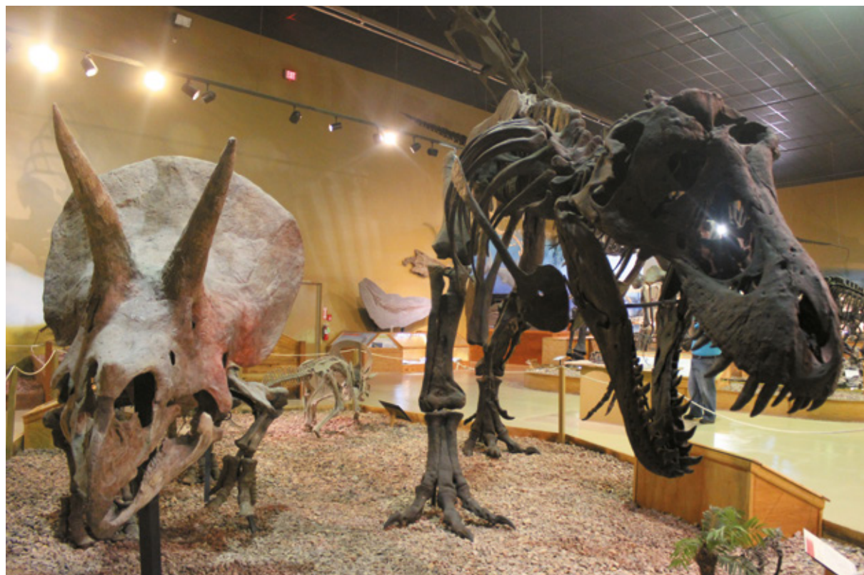
Centro del Dinosaurio, Thermopolis, Wyoming

Molti isolati della cittadina di Shoshoni versano in condizioni di abbandono. Numerosi gli alberghi e i negozi chiusi, di cui son rimaste solo le insegne. C'è un unico distributore di carburante, dove ci fermiamo per la solita bibita fresca e per il rifornimento.