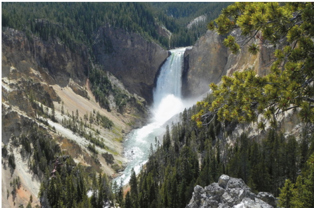
Il "Grand Canyon of Yellowstone"

il navigatore "ci comunica" che arriveremo più o meno a mezzanotte: la soluzione migliore sarà sostare alla Walmart, cosa che risulterà comoda anche per domani mattina, visto che abbiamo assoluto bisogno di rifornire la nostra cambusa.