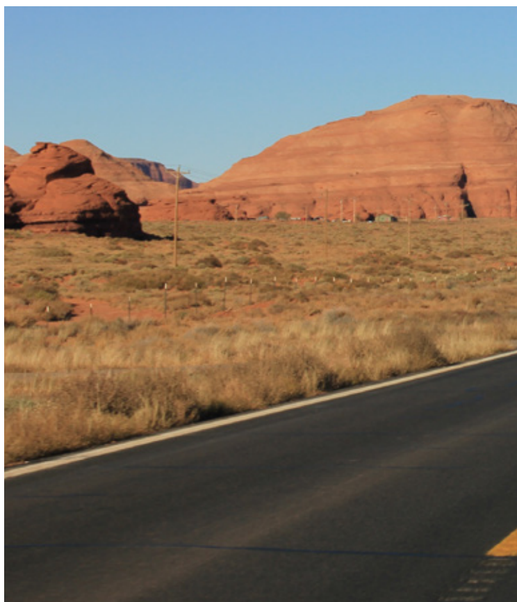
Sulle strade a perdita d'occhio degli Stati Uniti

L'occasione ci viene data da un matrimonio che si celebrerà in una città di confine tra Messico e Stati Uniti, spunto per un'idea di viaggio che si va man mano perfezionando durante la programmazione, ovviamente molto aiutati da Internet. Mappe on line alla mano, ci accorgiamo che ci si sta presentando l'opportunità di vedere terre lontanissime, finora conosciute solo nei film e nei documentari. Noi, pur iniziando i preparativi con notevole ritardo, siamo riusciti in due mesi a sviluppare un itinerario davvero fantastico. La prima cosa da fare, per chi non lo possiede già, è la richiesta del passaporto. Per il rilascio occorrono almeno quindici giorni dalla consegna della documentazione necessaria, ed è fondamentale soprattutto per la prenotazione del volo. Informazioni utili e dettagliate si possono avere consultando il sito della Polizia di Stato ( http://www.poliziadistato.it/articolo/1087/ ). Per chi è diretto negli Stati Uniti, inoltre, dal 12 gennaio 2009 può usufruire