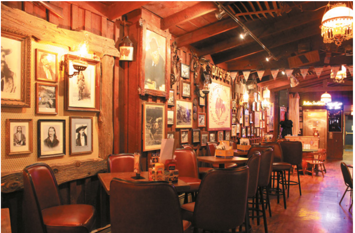
Saloon n°10, Deadwood, Sud Dakota

Al mattino una straordinaria sorpresa, che il buio della sera precedente ci aveva impedito di vedere: mentre preparo il tavolo esterno per la colazione alzo gli occhi e vedo la Devil's Tower : è visibile an-