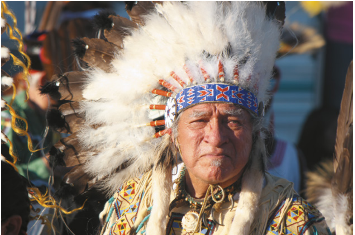
Powwow, Fort Washakie, Wyoming

telli dove è scritto il nome della località anche il numero di abitanti: lungo questo percorso ne vediamo alcune con dieci, al massimo quindici abitanti. Passiamo davanti a una "cittadina" chiamata Moneta: due abitazioni, di cui una sembra un ricovero per animali. Tantissima strada senza veder quasi nulla, tranne una piacevole interruzione per far passare una mandria: sembra di essere in un film. A Lusk, siamo sempre nel Wyoming, ci fermiamo per il pranzo. È una cittadina più grande delle altre, con un bel supermercato e parecchi negozi. Si sta svolgendo una festa nella piazza principale, dove, incuriositi, ci avviciniamo. Ci invitano immediatamente a metterci in fila: oggi ci sono gli hamburger di uno dei migliori ranch , insieme a contorni e dolci, offerti dalla banca locale per festeggiare i ragazzi che si sono diplomati. Vista la nostra indecisione insistono molto finché non accettiamo. Classifichiamo questa carne come una delle migliori mai mangiate! Facciamo un po' di spesa, ci riforniamo di carburante e poi di nuovo su strada. (continua nel prossimo numero)