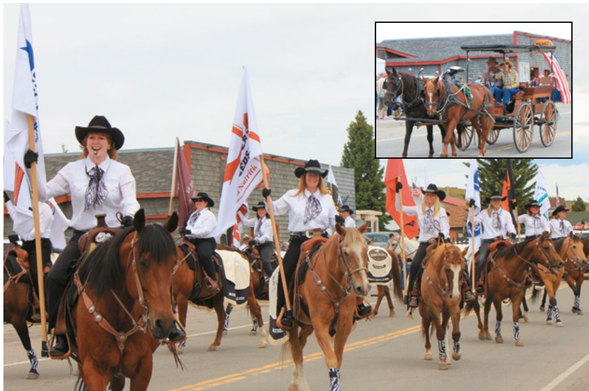
La "Parade" di Wilsall, Montana

Attraversiamo ancora una volta la Lewis and Clark National Forest , godendo di notevoli panorami. Piccoli agglomerati di "cabins", piccole casette di legno, si intravedono ogni tanto, e in alcuni tratti ci sembra di essere sui nostri Appennini. Non abbiamo programmato alcuna sosta per questo spo-