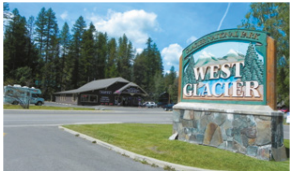
West Glacier, Glacier National Park