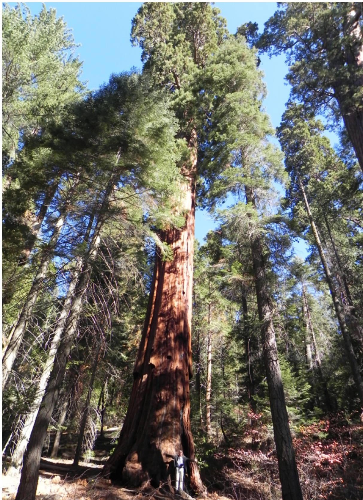
Sequoia National Park: da notare la proporzione tra questo maestoso albero e l'uomo alla sua base!