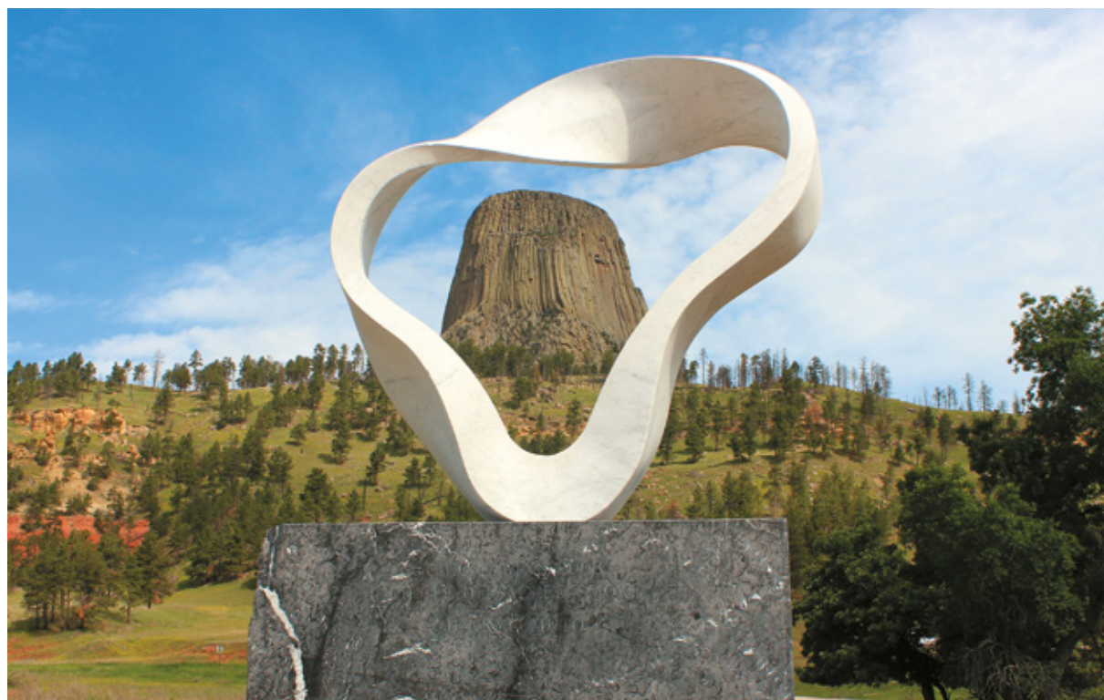
La Devil's Tower vista attraverso il "Circle of Sacred Smoke", Wyoming

Ma nel 1875 un tal Dodge, tenente colonnello incaricato di scortare un'esplorazione scientifica ai tempi in cui Custer con la sua spedizione aveva dato inizio alla corsa all'oro nelle Black Hills, riferì che gli Indiani la chiamavano The Bad God's Tower . Probabilmente ci fu un errore e il nome Bear Lodge venne interpretato come Bad God's , cui ne conseguì Bad God's Tower , che col tempo divenne Devil's Tower . Sulla "torre", dall'aria senza dubbio un po' misteriosa, si tramanda da sempre una leggenda: una tribù indiana era accampata lungo il vicino fiume Belle Fourche, e sette sorelle e un fratellino giocavano sereni, quando, improvvisamente, il fratellino si trasformò in orso. Le sette sorelle, impaurite e con l'intento di scampare a un'aggressione, salirono su una roccia. L'orso si ingigantiva sempre più e la roccia non era poi così troppo più alta, non tanto da proteggerle. Pensarono di pregare il Grande Spirito, perché le salvasse. La roccia le udì piangere e cominciò a alzarsi sempre più verso l'alto, mentre l'orso per arrampicarsi nel tentativo di raggiungerle, graffiò con le sue unghie i versanti