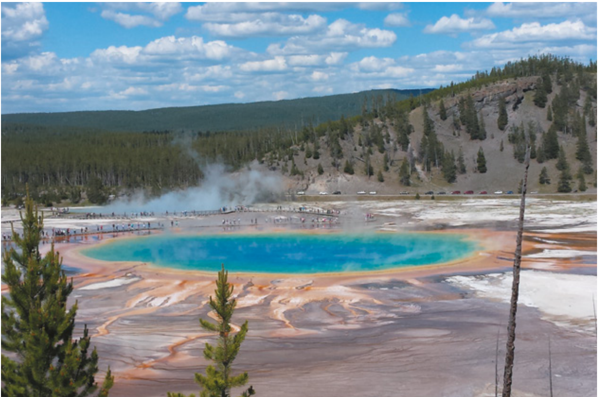
Il Grand Prismatic Spring, Yellowstone National Park

non perdere. Qualche minuto di viaggio e arriviamo alla prossima tappa in programma: il Grand Prismatic Spring . Parcheggiamo in un piazzale affollatissimo e ci incamminiamo tra decine e decine di visitatori. Avevo già visto le fotografie della grande pozza colorata su Internet, dato che è, insieme all' Old Faithful , uno degli scorci più noti del parco. Nonostante fossi preparata, la visione è superlativa: penso che siano pochi gli spettacoli naturali simili. Camminando sulle passerelle ci si avvicina molto, quindi, per fotografare al meglio è preferibile spostarsi un miglio avanti (il parcheggio è interdetto alle autocaravan, che devono restare lungo la strada) e percorrere una parte del Fairy Falls Trail . Si avrà una vista panoramica spettacolare del Grand Prismatic Spring dall'alto. Tornando al parcheggio uno scoiattolino ci accompagna e si lascia immortalare nelle pose più buffe. Fermata successiva al Biscuit Basin . Nel 1959 un terremoto di magnitudo 7.5 della scala Richter si verificò a qualche miglio di distanza dal luogo e, qualche giorno più tardi, la Sapphire Pool cominciò a eruttare violentemente,