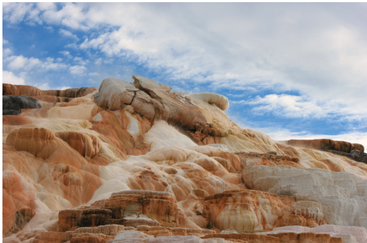
Mammoth Hot Springs, Yellowstone National Park

Finalmente siamo a Yellowstone , il Parco, dagli innumerevoli primati. Può essere suddiviso in diversi