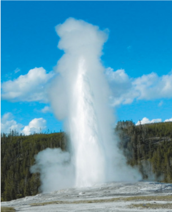
L'Old Faithful, uno dei geysir più famosi al mondo, Yellowstone National Park, Wyoming