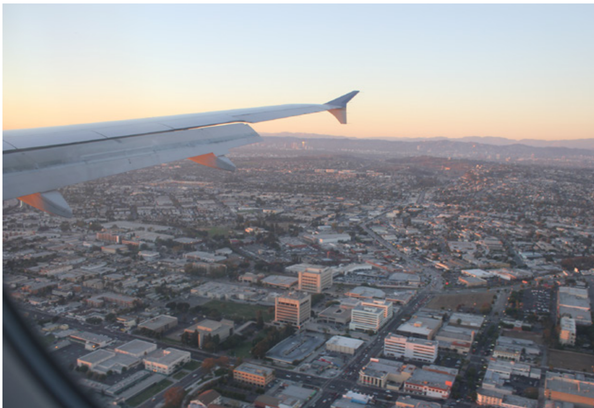
Los Angeles dall'aereo

molto più cari, ma più sicuri se si vogliono evitare problemi come la classica coincidenza persa per un ritardo del volo precedente. Anche in assenza di ritardi, il problema potrebbe presentarsi a causa del breve intervallo di tempo tra la discesa e la risalita. Ne è di esempio il controllo immigrazione, obbligatorio al primo aeroporto d'ingresso negli Stati Uniti, che potrebbe impegnare anche per due o tre ore. Prima di prenotare il volo, bisogna decidere che tipo di vacanza si andrà a fare. Se si opterà per autovettura+alberghi non ci sono problemi, visto che le agenzie di noleggio auto degli aeroporti sono aperte in genere (ma è sempre bene controllare) giorno e notte. Se, da camperisti convinti, non si vuole rinunciare al comodissimo RV (sigla usata negli USA che sta a indicare il Recreational Vehicles, in altri termini la nostra amata autocaravan), allora bisogna ponderare bene i giorni di noleggio. Generalmente, durante i giorni festivi, le agenzie di noleggio sono chiuse, e, comunque, non sono mai aperte