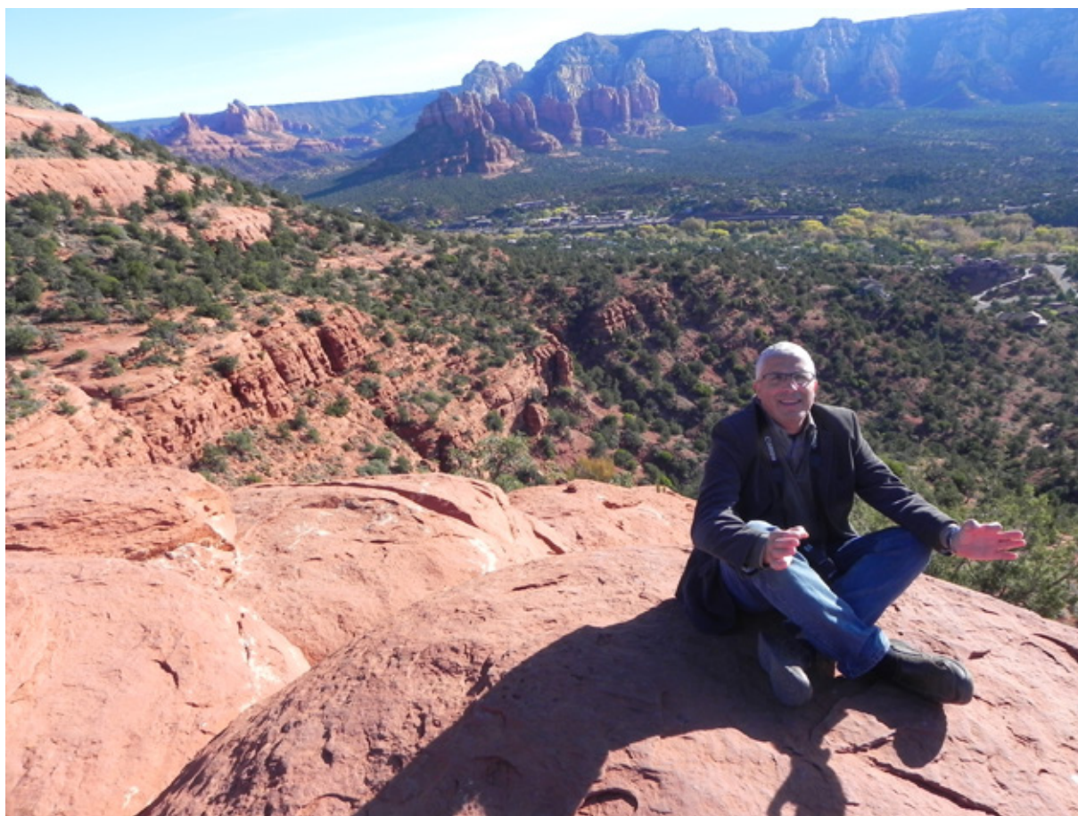
Sedona, sulla collinetta dei vortici vicino all'aeroporto

soggiornare non mancano gli alberghi, ma neanche i campeggi (come il Rancho Sedona RV, il Pine Flats Campground e l'Oak Creek Mobilodge).