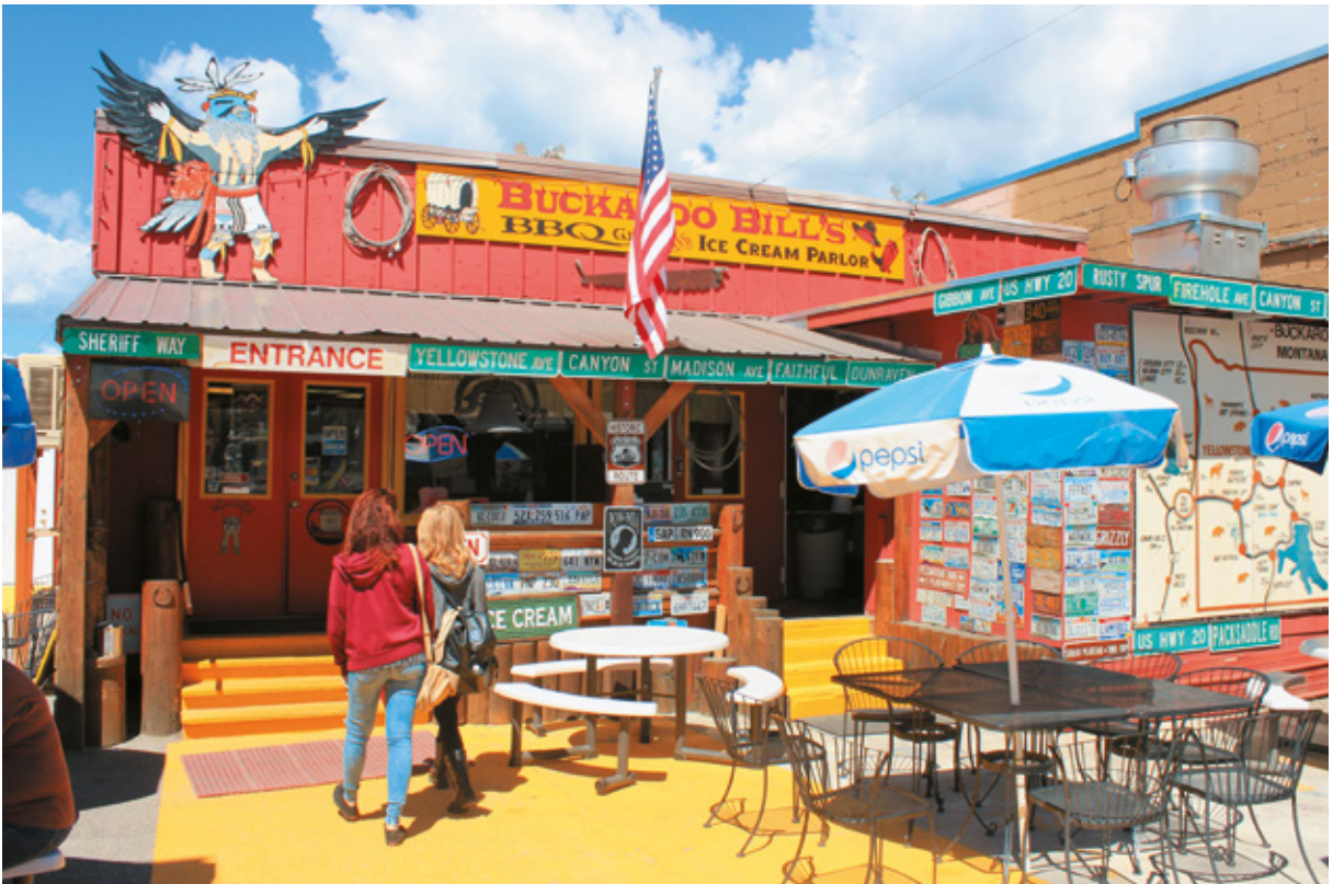
Si pranza al Buckaroo Bills di West Yellowstone