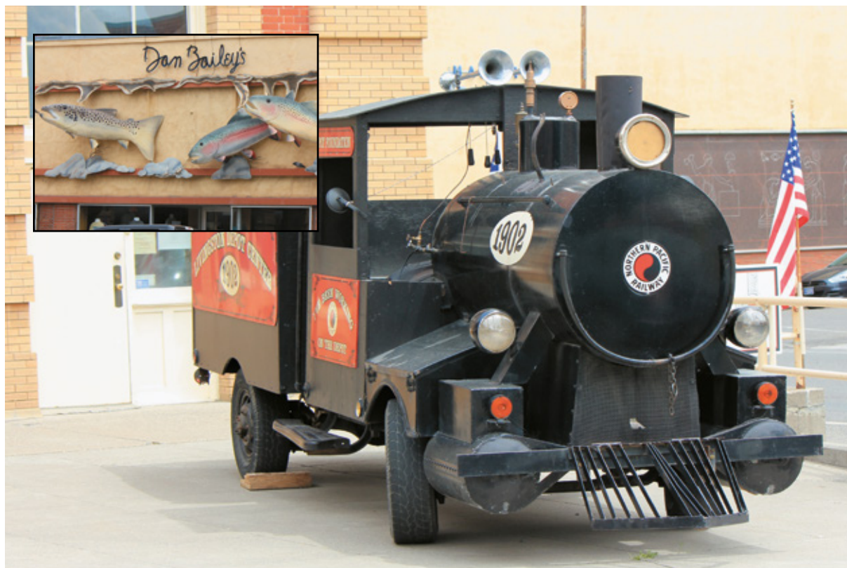
Livingston, un vecchio vagone ferroviario all'ingresso del Livingston Depot Centre e, nel riquadro, il negozio di Dan Bailey's

Prima di ripartire cerchiamo con successo la chiesa, anch'essa location del film. A questo punto impostiamo il navigatore per la prossima destinazione: Yellowstone National Park , che leggerete nel prossimo numero.