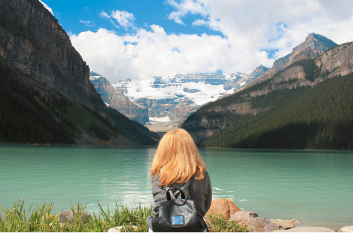
Bow Lake, Alberta, Canada

più o meno a mezzanotte con i miei cugini ancora svegli ad aspettarci. Ci accolgono festosi e ci fanno sistemare nel loro giardino!