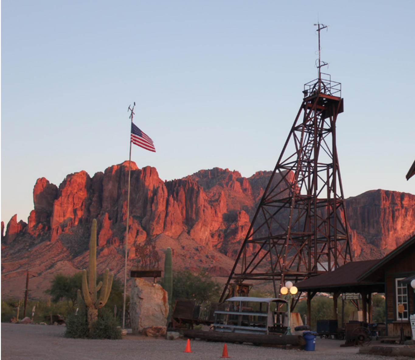
La città fantasma di Goldfield

C'è anche un vero museo da visitare: il museo delle superstizioni locali. Si può anche fare un giro sulla ferrovia antica e assistere a finti duelli di personaggi in costume davanti al saloon. Le antiche case oggi ospitano negozi di souvenir; un posto per foto d'epoca, il saloon/ristorante, mentre la chiesa è oggi utilizzata per celebrare matrimoni. Si deve però procedere con cautela; infatti, all'ingresso del paese c'è scritto: non ci sono norme di sicurezza applicate e tutto è rimasto come tanti anni fa, prestare attenzione! Scattiamo le ultime foto mentre il sole sta tramontando e iniziamo ad avviarci verso il nostro prossimo punto di riferimento: Tucson. Ripercorriamo il breve tratto della Highway 60, conosciuta come la Superstition Freeway, e imbocchiamo la State Route 79 (la Pinal Pioneer Parkway), per poi svoltare sulla State Route 77.