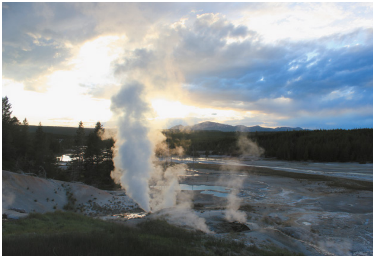
Norris Geyser Basin, Yellowstone National Park

uno spettacolo straordinario, tra nuvole di vapore che fuoriescono dalla terra e stupendi colori.