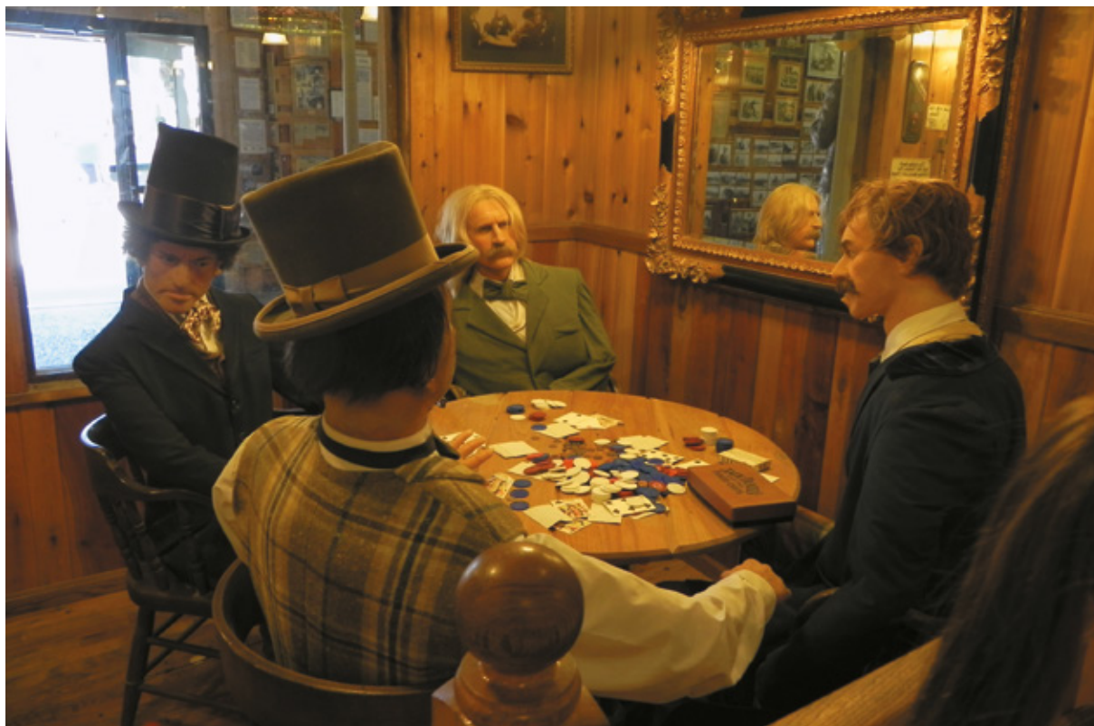
Wall Drug, la rappresentazione della "Dead Man's Hand", Sud Dakota

la tradizione della "ice cold water" si conserva ancora oggi. Inoltre installarono numerosi cartelloni pubblicitari disseminati lungo la strada che, a distanza regolare, annunciavano il negozio, con lo scopo di dare un punto di riferimento a coloro che attraversavano il Sud Dakota costretti a viaggiare per miglia e miglia in mezzo al nulla.