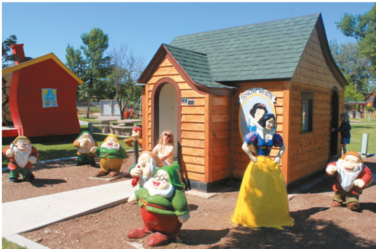
Lo Storybook Island, Rapid City, Sud Dakota

Poco distante da qui c'è il Parco dei Dinosauri, al 940 di Skyline Dr. ( http://www.dinosaurparkblackhills.com ), aperto al pubblico fin dal 1936: era la triste epoca della Depressione, e come in molti altri posti degli Stati Uniti, si progettaron e realizzarono opere pubbliche in modo da creare lavoro e rendere i luoghi più accattivanti per i turisti, importante fonte di guadagno. Salendo sulla scalinata appaiono pian piano le cinque imponenti riproduzioni di dinosauri a grandezza naturale, fino ad arrivare allo splendi-