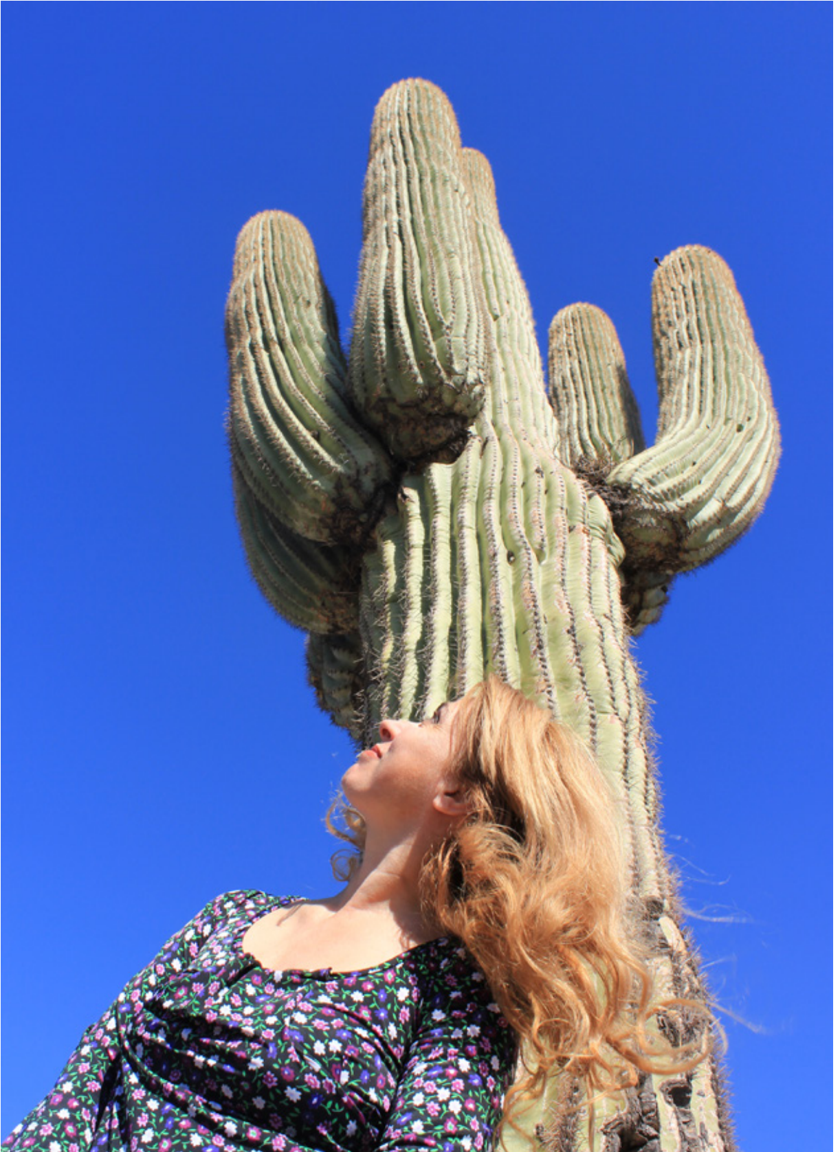
Un enorme Saguaro