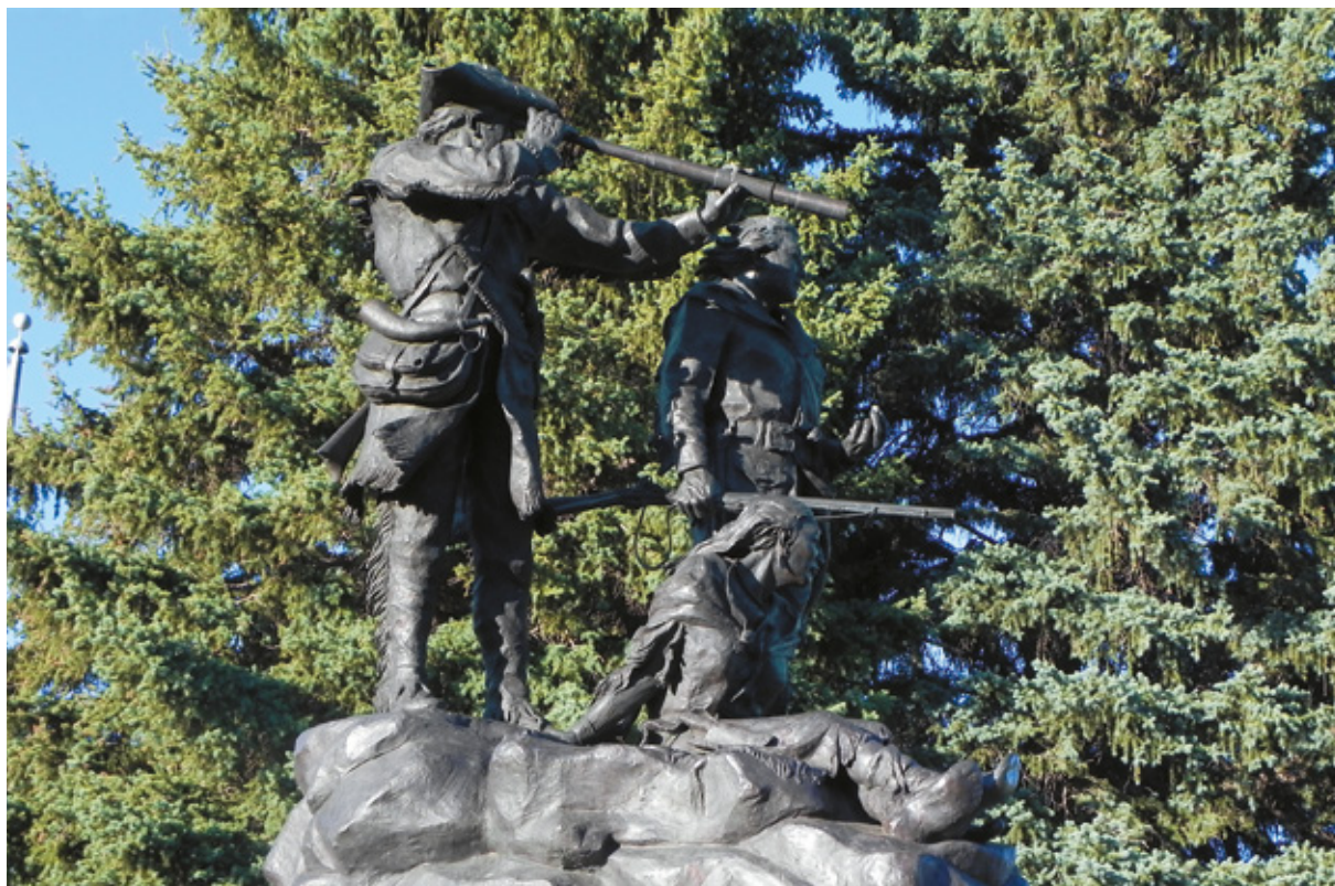
Monumento a Lewis Clark, Fort Benton, Montana

Conoscevamo già questa commovente storia, e vedere il monumento ci ha confermato quanto sia stato caro a tutta la cittadinanza.